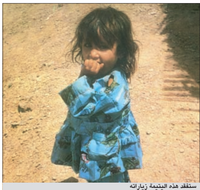
ستفقد هذه البيتمة زيارته