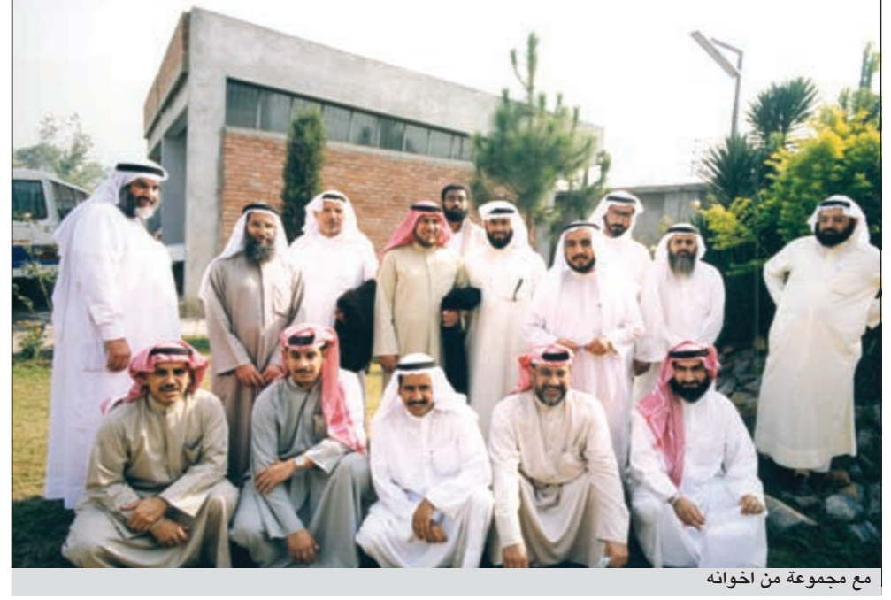
مع مجموعة من اخوانه

رائد مميز من رواد العمل الخيري الكويتي ابن جمعية الإصلاح الاجتماعي