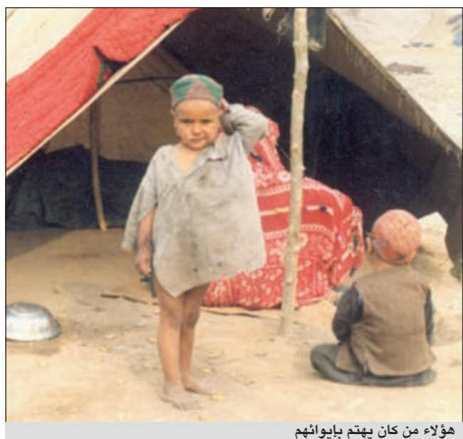
هؤلاء من كان يهتم ببايواتهم