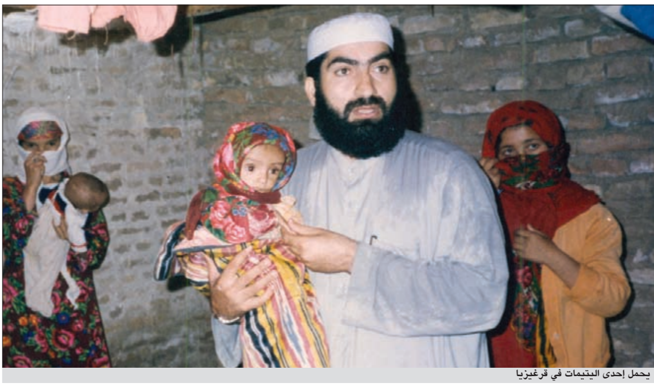
يحمل إحدى اليتيمات في قرغيزيا

على يديه طيلة عمله في اللجان الخيرية التابعة لجمعية الإصلاح الاجتماعي.