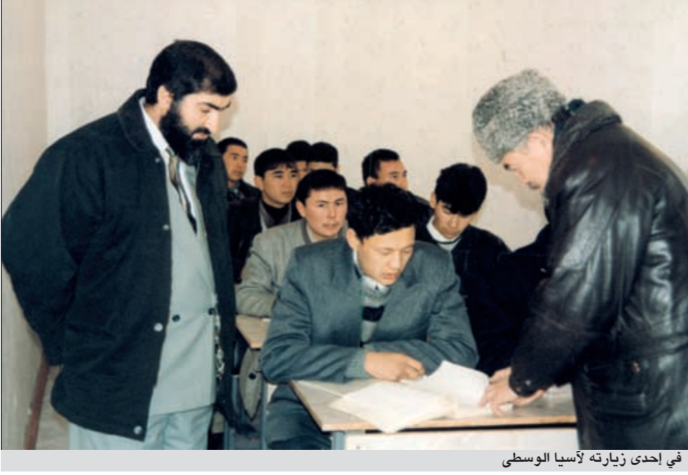
في إحدى زيارته لآسيا الوسطى