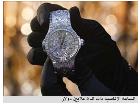
الساعة الماسية ذات الـ 5 ملايين دولار

بال - أ.ف.ب. كشفت شركة «أوبلو» السويسرية لصناعة الساعات عن ابتكار فريد لها هو عبارة عن ساعة بخمسة ملايين دولار مرصعة بأكثر من 1200 ماسة من بينها ستة أحجار نزيد عن ثلاثة قراريط وهي قطعة استثنائية أعرب كثيرون من الآن عن اهتمامهم بها على ما قال جان - كلود بيفر رئيس الشركة.