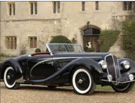
سيارة شارل ديغول

باريس - أ.ش. يحتضن جاليري سترون معرضا حول أنواع السيارات من ماركة «سترون» والمخصصة لرؤساء الجمهوريات الفرنسية، ويستمر حتى نصف يونيو القادم.