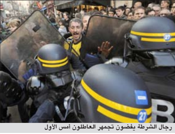
رجال الشرطة يفضون تجمهر العاطلون أمس الأول

باريس - أ.ش. احتل ناشطون في مجال مكافحة البطالة مطعم «فوكيتس» الفاخر بباريس والذي كان قد اختاره الرئيس الفرنسي اليميني نيكولا ساركوزي للاحتفال فيه بفوزه في الانتخابات الرئاسية الفرنسية لعام 2007 وذلك للتعبير عن سخطهم على عدم وضع البطالة على رأس الحملة الانتخابية للرئيس ساركوزي.