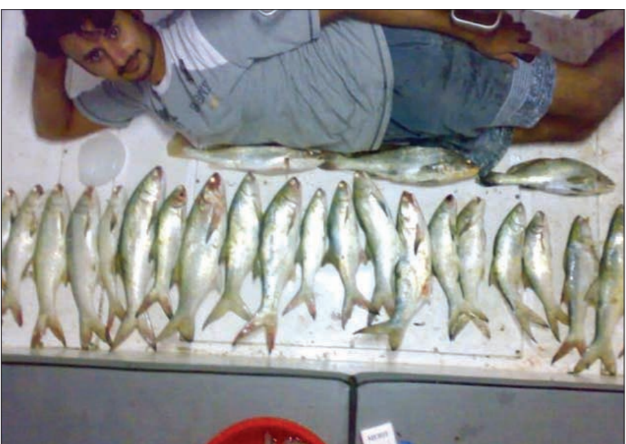
استراحة محارب مع الشيم