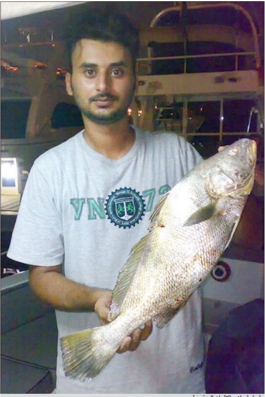
فرخ شمالي الاقواع الجنوبية