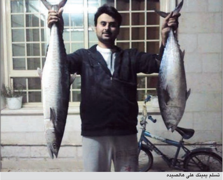
تسلم يمينك على الصيد

● اسبوعيا نسلط الضوء على هذه الهواية، ونستقبل مشاركاتكم وصوركم وآراءكم. للتواصل معنا عبر هذه الصفحة أرسلوا تعليقاتكم على الايميل: bahri@alanba.com.kw ● اعداد: هادي العنزي