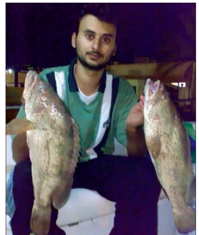
بواليل للبيج يا الربيع

«سماري شمالي وإذا زعزع شمالي قط خيطك ولا تبالي»، جوك بارد وصيدك حار سمكتك طيبة ويتعب عليها كل حدائق ليلك بالبحر ونيس على قمره وامواج البحر تهيج وانت يا ابن الديرة وبين تلقى البحر هذا وبياي ديرة.