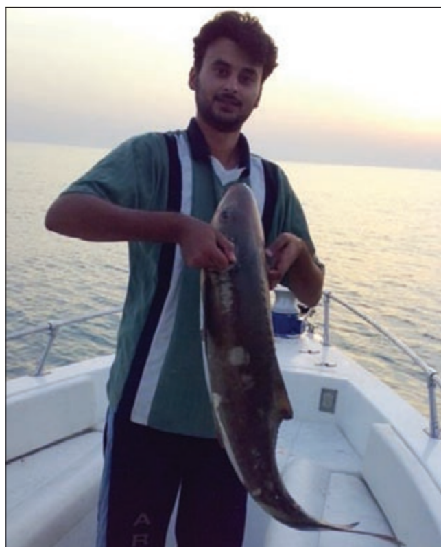
بصراحة خوش سكن