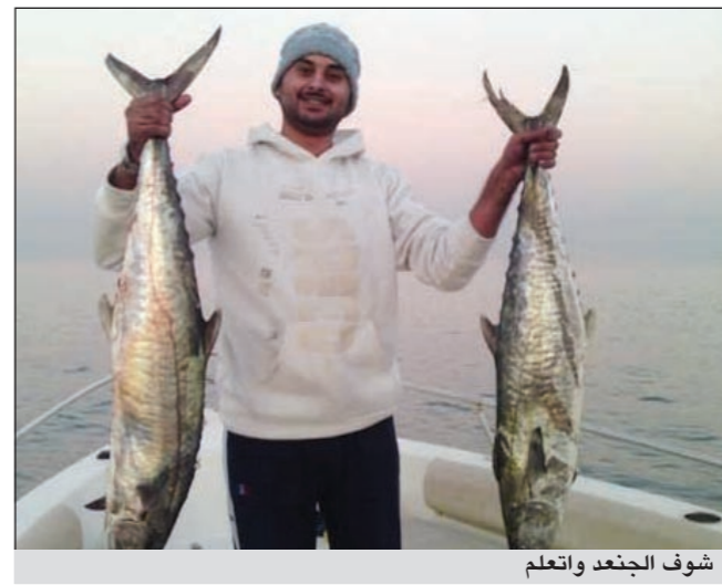
شوف الجندع واتعلم

يوجد من يهتم للأمر أم لا؟ هنا تستطيع أن تفكر وتبحث في عقلك عن مقترح أو حل لمشكلة المسنات ولكن سوف أقول لكم يا صفة «بحري» عن بعض المشاكل أو لا بحرنا يقبل عليه المواطن والمقيم وقد انعم رب العالمين علينا بشواطئ وسواحل جميلة وكبيرة ولكن نتيجة لانشغال المسؤولين بأمور أقل أهمية من بحرنا أصبح هذا الساحل الكبير العريض صغيرا على أصحاب هواية الحدائق والطاريد، وانظر الى المسنات أيام العطل الرسمية أو عطلة نهاية الاسبوع وشوف الزحمة الموجودة هذا إذا ما حصل هناك أي مشاجرات بسبب تخلي الدور أو اسباب أخرى يا أخي لماذا لا يضعون مسنات جديدة ورسوما بسيطة أو رمزية ما الصعب في ذلك.