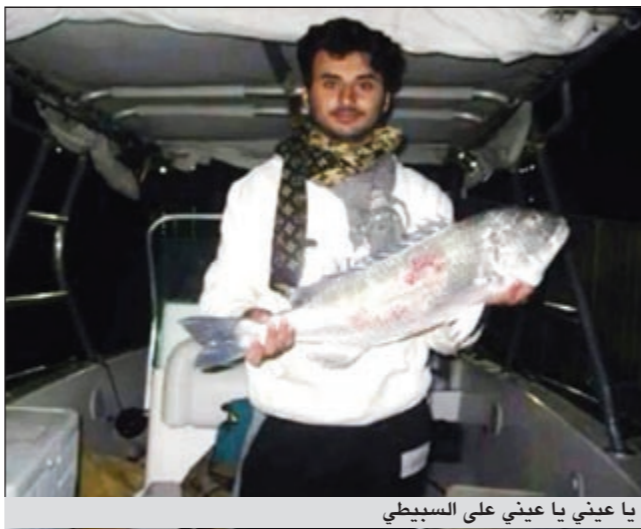
يا عيني يا عيني على السبب