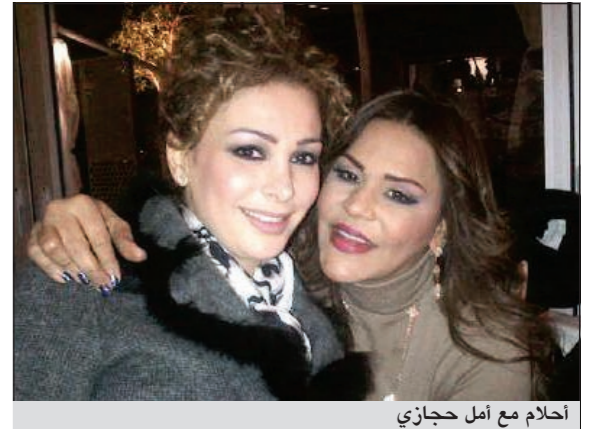
أحلام مع أمل حجازي

بيروت: تستمر اللقاءات التي تجمع الفنانة أحلام بالفنانات اللبنانيات، فبعد الفنانة نجوى كرم، والفنانة ميريام فارس والفنانة إليسا، نشرت الفنانة أحلام صوراً لها وللفنانة أمل حجازي. ولم تذكر أحلام في الصور التي نشرتها عبر حسابها الخاص على موقع التواصل الاجتماعي «تويتر» المناسبة أو المكان الذي جمعها بالفنانة أمل حجازي.