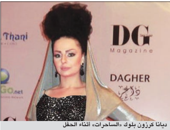
ديانا كرزون بلوك «الساحرات» أثناء الحفل

بلوك جديد يشبه إلى حد كبير ما تظهر به النجمة الأمريكية الخيرة للجلد دائماً لبيدي غاغا، ظهرت المطربة الأريضية ديانا كرزون في حفل توزيع جوائز مهرجان مجلة «دير جيست» في القاهرة. وتناقلت صفحات «فيسبوك» «لوك» ديانا في الحفل، الذي رأى كثيرون أنه يشبه «الساحرات». وارتدت ديانا فستاناً بقماس Metallic وقصة ضيقة مع أكمام واسعة طويلة وقبعة تشبه قبعة القبطان، وصلتها مع شعرها الذي رفعت به بشكل كعكة «منقوشة» ومسحة نحو الأعلى. ووضع شباب «فيسبوك» صوراً للفتاة الأمريكية ظهرت فيها بلوك قريب من الذي ظهرت به ديانا كرزون، ونساء لوان، بحسب ما ذكر موقع «ام بي سي»: هل ديانا ترغب في تقليد لبيدي غاغا.. أم أنها أحببت اتباع هذا «اللووك» من باب التغيير والمرح؟، لكنهم في الوقت ذاته حذروها من السير على خطى لبيدي غاغا التي عرفت دائماً بجرأتها الزائدة عن الحدود. وكانت ديانا قد أعلنت عبر صفحتها الرسمية على «فيسبوك» أن إطلالتها بالحفل من تصميم المصمم العالمي «سوشا»، كما قالت إن مشاركتها في الحفل جاءت تلبية لدعوة من إدارة المجلة والمهرجان الذين تربطها بهم علاقة صداقة قوية.