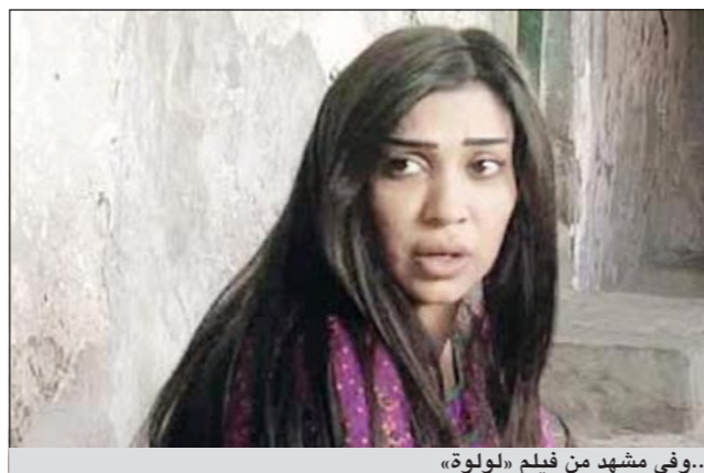
..وفي مشهد من فيلم «لولوة»