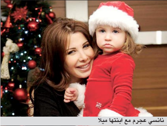
نانسي عجرم مع ابنتها ميلا

تخضع النجمة اللبنانية نانسي عجرم مع ابنتها «ميلا» وإيلا» اليوم لجلسة تصوير خاصة بمناسبة عيد الأم الذي يصادف 21 الجاري. ووجهت نانسي تحية للفتان على صفحاتها الإلكترونية، وقالت بحسب موقع «الصحافة»، إنها ستخضع لجلسة تصوير مع ابنتها بمناسبة عيد الأم، كما اطلق خبير التجميل فادي قفايا بدوره تغريدة على صفحته أعلن فيها عن وجوده مع نانسي في جلسة التصوير، كونه الذي يهتم بإطلالة نانسي، وكانت نانسي عجرم قد أجلت تصوير الكليب الجديد لأغنية «مين اللي ما عندي»، بسبب سوء الأحوال الجوية في لبنان. وتستعد نانسي حالياً لتصوير كليبين، الأول «مين اللي ما عندي»، تحت إدارة مخرج اختارته شركة «داماس» للمجوهرات، ويعتبر استكمالاً للإعلان الذي كانت نانسي قد صورته للشركة على وقع هذه الأغنية بالتحديد.