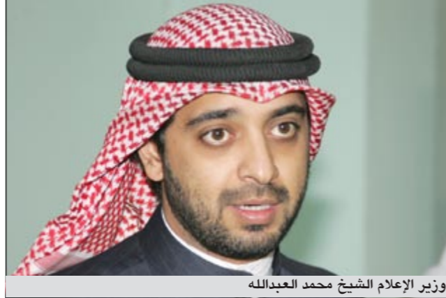
وزير الإعلام الشيخ محمد عبدالله

أعود لتكرار هذه التجربة لكني لم أجد النص المناسب، حتى جاء لي سيناريو الإمام الغزالي فتمسكت له بشدة وقررت أن أنفرض له، خصوصاً بعدما وجدت حماساً من القائمين على المشروع سواء المؤلف أو المخرج أو الشركة المنتجة التي لم تبخل حتى الآن في الاتفاق على التحضيرات للمسلسل.