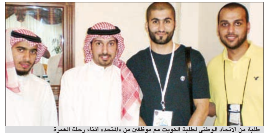
طلبة من الاتحاد الوطني لطلبة الكويت مع موظفين من «المتحد» أثناء رحلة العمره

موضا ان رعاية البنك لرحلة العمره التي ينظمها الاتحاد الوطني لطلبة الكويت - فرع الجامعة تقع ضمن الأعمال الخيرية التي يقوم برعايتها البنك الاهلي المتحد ضمن مسؤوليته الاجتماعية تجاه المجتمع وخاصة فئة الشباب. ومن جهتهم عبر المشاركون في العمره من الاتحاد الوطني لطلبة الكويت عن خالص امتنانهم وشكرهم لإدارة البنك الاهلي المتحد لما قدموه لهم من دعم وتيسير خلال رحلة العمره التي من مزيد من أوجه التعاون مع المتحد.