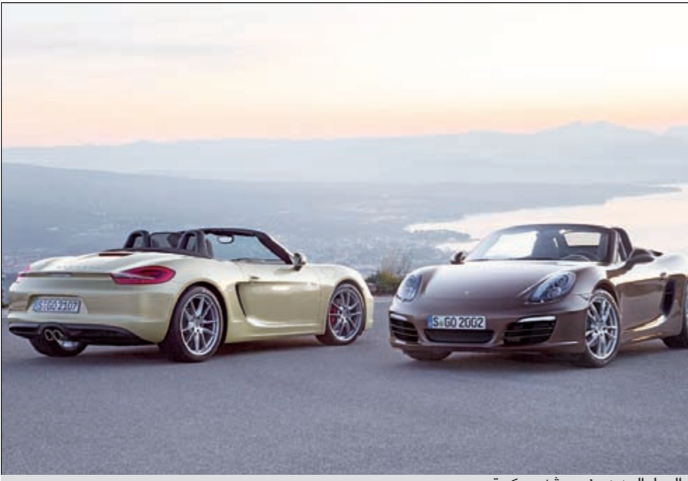
الجيل الجديد من بورشه «بوكستر»

أعلنت شركة بورشه الألمانية لصناعة السيارات، ومقرها شتوتغارت، انها تقدم الجيل الجديد من بورشه «بوكستر» للمرة الاولى عالميا في معرض جنيف للسيارات، الذي سيفتح ابوابه اليوم السادس من مارس 2012، كما ستألق منصة عرض الشركة بطرازين جديدين يسجلان اطلاقهما الاولى على الساحة الاوروبية.