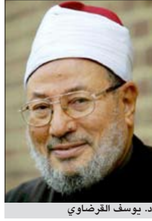
د. يوسف القرضاوي