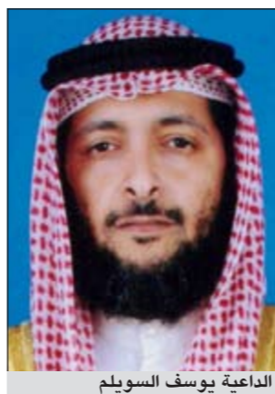
الداعية يوسف السويلم

في اي وجه تزيد من قوة العدو اقتصاديا ولا بد من هذه المقاطعة حتى يتحسر الأقصى ويعود للمسلمين. أواقفه تماما