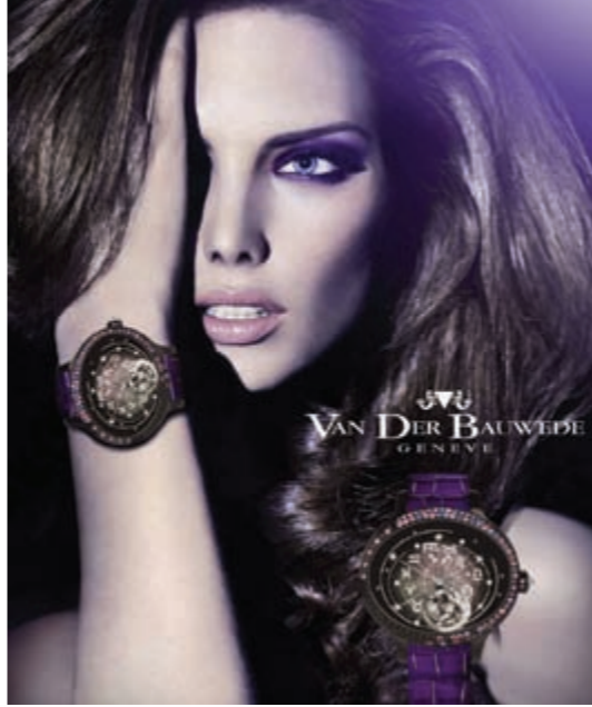
ساعات Van Der Bauwede