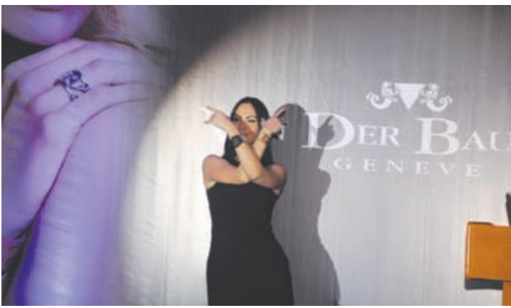
عارضة من الحفل