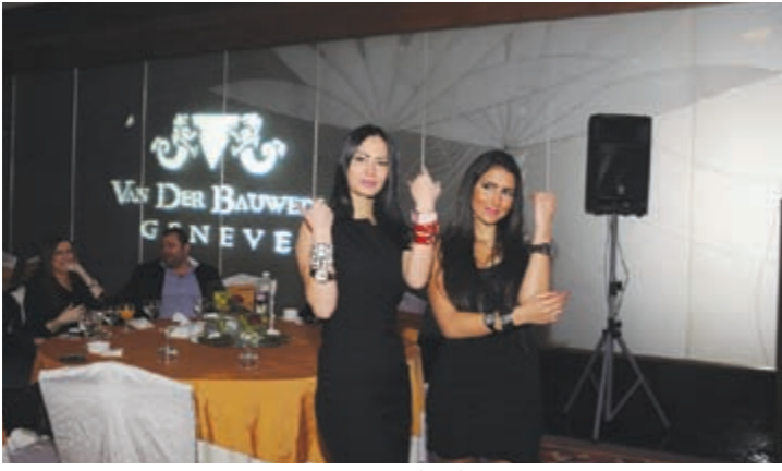
عارضات من الحفل