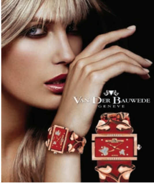
ساعات Van Der Bauwede