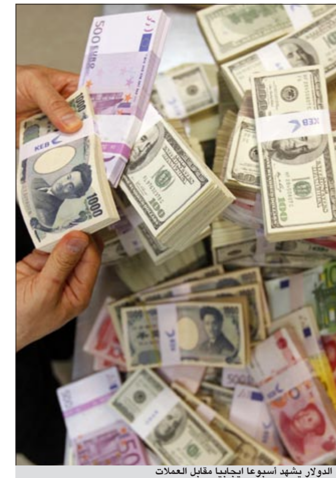
الدولار يشهد أسبوعاً إيجابياً مقابل العملات

أعلى مستوى له عند 1,3485 دولار ليترجع بعدها الى 1,3240 دولار وليقلل الأسبوع عند 1,32 دولار. أما الجنيه الاسترليني فقد تمتع بأداء مختلف نوعاً ما وذلك مع غياب حصول أي أحداث كبرى في السوق ومع عدم إصدار أي تقارير تتعلق بالمعطيات الاقتصادية الحالية فقد افتتح الجنيه الأسبوع عند 1,5875 دولار وتراجع الى 1,5800 دولار ثم ارتفع ليصل الى 1,5995 دولار وليقلل الأسبوع يوم الجمعة عند 001,59 دولار. وشهد الفرنك السويسري أداء مشابهاً لآداء اليورو حيث تراجع مقابل الدولار الأميركي من 0,8960 دولار الى 0,9150 دولار وليقلل الأسبوع 0,91 دولار. وقد شهد زوج العملات الدولار الأميركي/ الين الياباني أسبوعاً هادئاً حيث افتتح الأسبوع عند 81,20 ينًا/ دولار واقفل عند 81,81 من ناحية أخرى شهد الذهب أداء مضطرباً له خلال الأسبوع الماضي إذ تراجع يوم الأربعاء عن مستوياته السابقة التي بلغت 1,790 دولار في السابق ليصل الى 1,688 دولار ليقلل الأسبوع عند 1,712 دولار. وقد أعرب رئيس الفيدرالي الأميركي برنانكي عن عدم تفاؤله