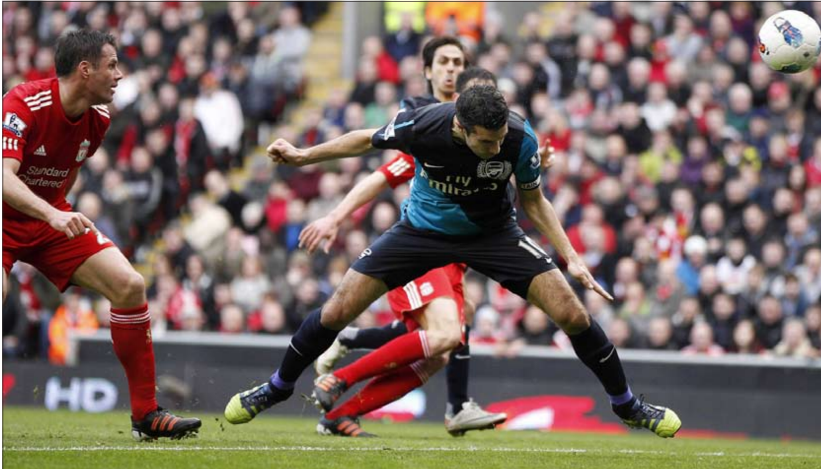
رأسية نجم أرسنال روبن فان بيرسي في طريقها إلى هز شبك ليفربول

انتهت قمة ليقربول وضيغه أرسنال في افتتاح المرحلة السابعة والعشرين من الدوري الإنجليزي لكرة القدم امس بخسارة الأول 1-2. على ملعب أنفيلد رود، أراد ليقربول الاستفادة من فرصة اللعب على أرضه وإضافة 3 نقاط ثمينة من خصم عنيد رغم نتائج المتذبذبة كما هي حاله بالضبط، وهاجم منذ البداية فكانت الفرصة الأولى الحقيقية من نصيبه عندما حصل الأوروغوياني لوس سواريز على ركلة جزاء كانت من صنع الحارس البولندي فويسيتش شيتشيني الذي نجح في صد ركلة الهولندي ديرك كاوت (19). وعوض ليقربول الفرصة الضائعة بعد دقائق قليلة عندما جنح جوردان هندرسون في الهروب وأرسل كرة عرضية حاول المدافع الفرنسي لوران كوسيلتي اعتراضها فحولها الى مرمرى فريقه (23). ولم تدم فرحة «الفريق الأحمر» طويلا إذ استطاع الضيوف ادراك التعادل بعدما تلقى الهولندي روبن فان بيرسي كرة رابعة من الفرنسي بكاري سانيا قابلها برأسه ووضعها بسهولة في شبك الحارس الإسباني خوسيه مانويل رينا (31). وفي الشوط الثاني، استمرت المحاولات من الطرفين وأضاعا فرصا عدة كانت أبرزها لأرسنال بعدما قام كيران غيبس بمجهود رائع وأرسل كرة الى ثيو والكوت الذي سد بقوة فارتطمت بقدم احد المدافعين وكادت تنجح رينا لكن ردة فعل الأخير كانت جيدة وأبعدها بقدمه اليسرى وأزال الخطر (71). ولم يقبل أرسنال الخروج بنقطة واحدة من اللقاء، وتابع محاولاته التي أثمرت إحداها هدف الفوز بعد أن أرسل الكامبروني