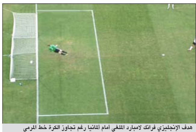
هدف الإنجليزي فرانك لامبارد الملغى أمام ألمانيا رغم تجاوز الكرة خط المرمى

في ألمانيا والمدير السابق في الأنتربول، رئاسة قسم أمني جديد بالفيفا، حسب ما أعلنه الاتحاد. وسجل موتشك مكان الأسترالي كريست إيتون الذي أعلن استقالته قبل أسبوعين. وذكر فيفا في بيان أن القسم الأمني الجديد سيكون مسؤولا عن «جميع القضايا الأمنية المتعلقة ببطولات الفيفا في أنحاء العالم، ومفاهيم الأمن في كرة القدم بشكل عام، وأمن مقر «فيفا» في زيوريخ وكذلك أمن رئيس فيفا ومجلس الإدارة. وقال موتشك، الذي اكتسب خبرة طوال 33 عاما في مهام مختلفة بجهاز الشرطة الجنائية الاتحادية في ألمانيا، إن «احتياطات السلامة في بطولات فيفا، ستكون قضيته الأساسية. وأضاف «التركيز هنا سيكون على مكافحة التلاعب في مباريات، ويتولى موتشك (52 عاما)، أحد كبار المديرين في جهاز الشرطة الجنائية الاتحادية