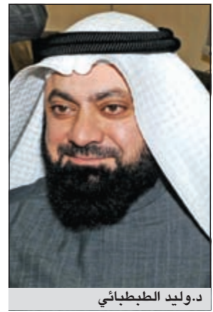
د. وليد الطبيباني

وقدم النائب د. وليد الطبيباني اقتراحا برغبة جاء فيه: يعتبر تطوير الرعاية الصحية من الاولويات التي يوليها كل من مجلس الوزراء ومجلس الأمة اهتماما كبيرا، والذي سينعكس على تقديم خدمات صحية افضل للمواطنين والمقيمين وقد سبقتنا الدول المتقدمة حين وضعت منظومة متكاملة مستقلة للاعتقاد والاعتراف بجودة المؤسسات الصحية والتي تعني بتقييم أداء المؤسسات الصحية والخدمات الصحية والتي الى اهدافها ان يطمئن المريض الى