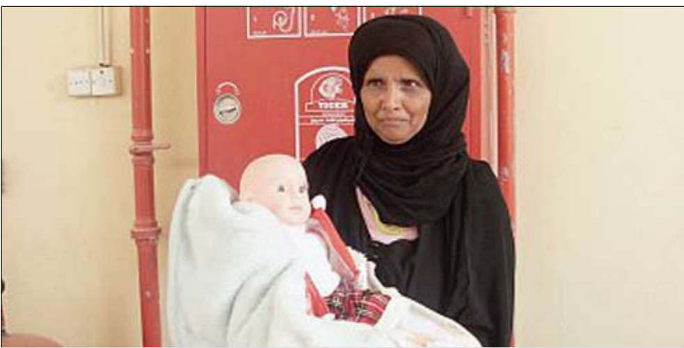
متسولة توهم المحسنين بحمل «دمية»، على أنها طفل (الرياض السعودية)

ما يسكنها مخالفو نظام الإقامة والعمل من الوافدين من جنسيات مختلفة حيث أسفرت هذه الحملات عن ضبط 26 رجلا و46 سيدة و32 طفلا. كما ضبطت اللجنة الأمنية لمكافحة التسول في نفس الفترة 845 متسولا ومتسولة من جنسيات عربية وآسيوية مختلفة من ممتهني التسول في العاصمة الرياض بينهم 771 من الرجال و59 سيدة و115 طفلا. وأهابت اللجنة بالمواطنين والمقيمين للإبلاغ عن ملاحظاتهم عن المتسولين ومواقعهم عبر الهاتف 2411678 والتي ستكون محل اهتمام جميع العاملين بالحملة.