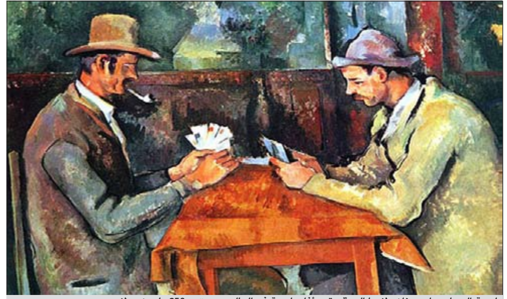
لوحة الرسام بول سيزان «لعبا الورق» تعد أعلى لوحة في العالم ويبيع ب 250 مليون دولار

العربية.نت: وسط الجهود التي تبذلها قطر لكي تصبح مركزا ثقافيا مرموقا، من خلال تنظيم معارض لكبار الفنانين والتخطيط لافتتاح ما يقرب من 12 معرضا جديدا خلال الأشهر الستة القادمة، يقول المحللون إن أعدادا متزايدة من هواة الاقتناء القطريين قد أصبحوا مستثمرين رئيسيين في مجال اللوحات الفنية. وقد أصبحت قطر نفسها أكبر مشتر في العالم في سوق الفنون، بحسب جريدة الفنون الدولية المتخصصة في الموضوعات والفضايا الفنية.