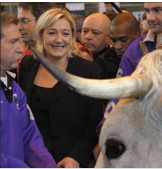
مارين لوين خلال حضورها معرضا للماشية في باريس امس

باريس - يوبي.آي: اعتبر كبير حاخامات فرنسا جيل بيرنهام مرشحة الجبهة الوطنية مارين لوين «تهديدا» للقيم الفرنسية. وقال بيرنهام في مقابلة مع قناة «أوروبا 1» أمس ان لوين تشكل تهديدا على قيم فرنسا حين تخفض من مرتبة الرجال والنساء بتقسيمهم إلى «فئات المهاجرين والغريب والمسلمين»، وأعتقد انه يوجد سوء استخدام للغة. وأشار إلى انه «يوجد مهاجرون يتصرفون بشكل سيئ وآخرون يتصرفون جيدا».