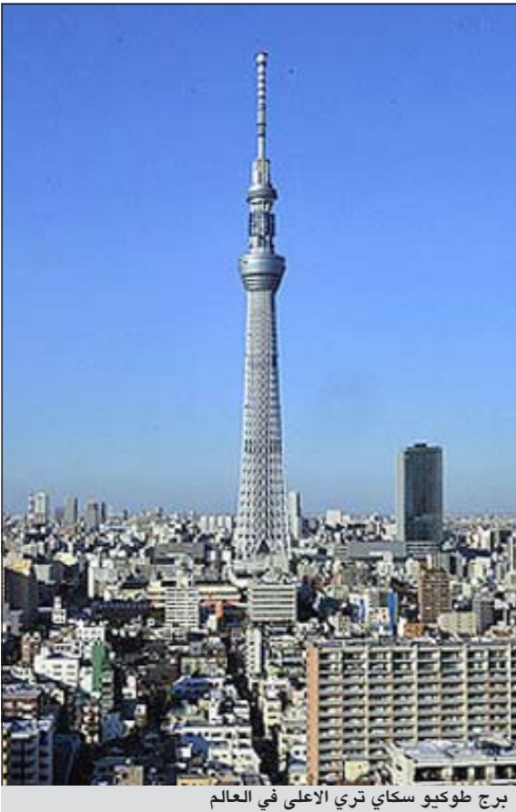
برج طوكيو سكاى تري الأعلى في العالم

طوكيو - كونا: اقامت اليابان امس احتفالا بمناسبة الانتهاء من بناء برج طوكيو سكاى تري البالغ ارتفاعه 634 مترا وهو أعلى برج في العالم والذي سيفتح أبوابه للعام في الـ 22 من مايو المقبل.