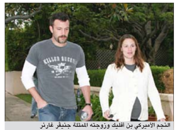
النجم الأميركي بن أفليك وزوجته الممثلة جنيفر غارنر

لوس أنجلوس - يوبي.آي: أطلق النجم الأميركي بن أفليك وزوجته الممثلة جنيفر غارنر اسم «صامويل» على ابنهما الذكر الأول الذي استقبله الثلاثة الماضي.