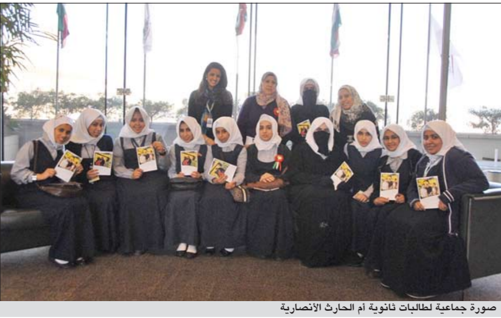
صورة جماعية لطالبات ثانوية أم الحارث الأنصارية