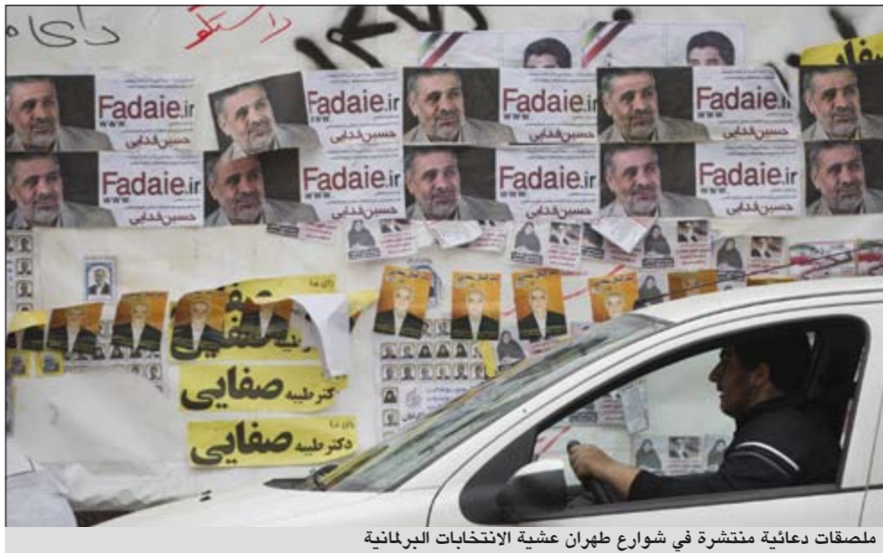
ملصقات دعائية منتشرة في شوارع طهران عشية الانتخابات البرلمانية

السابق محمد خاتمي لكن فرصة حليف سابق للرئيس ومن المتوقع أن يكون على رأس مرشحي المحافظين في السباق الرئاسي العام المقبل.