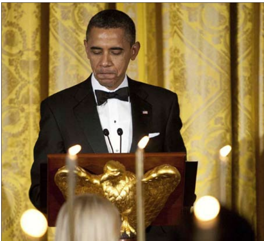
أوباما خلال العشاء التكريمي لـ 80 مقاتلا سابقا في العراق (رويتز)

الي ذلك اعرب اوباما عن «ثقتة» من ان المهمة القتالية الاميركية في افغانستان ستنتهي في العام 2014 على الرغم من اعمال العنف التي جرت مؤخرا في البلاد.