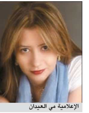
الإعلامية مي العيدان