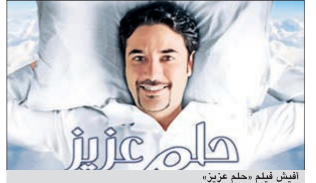
أفيش فيلم «حلم عزيز»