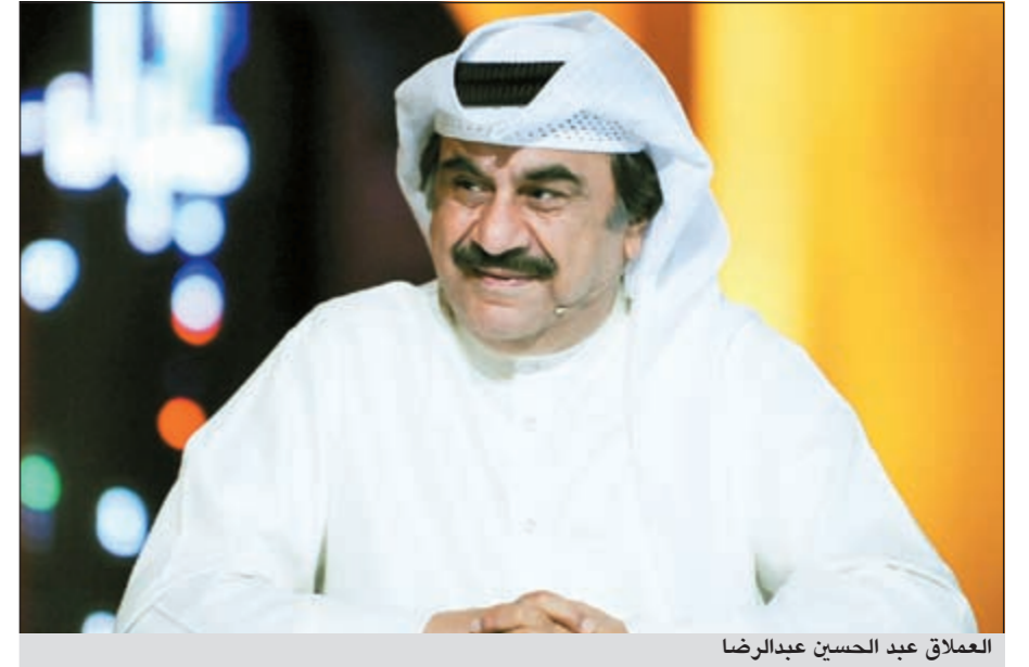
العلاق عبد الحسين عبدالرضا