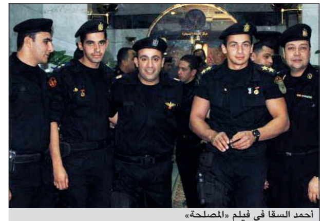
أحمد السقا في فيلم «المصلحة»

والمخدرات، ويعتبر هذا الدور بحسب موقع «عيون عالفن»، مغامراً لجميع أدوار السقا السابقة حيث دائماً ما يقدم دور المجرم أو الهارب من قبضة الأمن وملاحقات الشرطة. وعاش السقا في الفترات الماضية داخل عدة جهات أمنية حتى يستطيع أن يتعايش مع دور ضابط العمليات الخاصة، وقام بعدة تدريبات صعبة لدرجة أنه أقام صداقات شخصية مع بعض الضباط الشباب، كما يظهر بالصور التي تم نشرها مؤخراً.