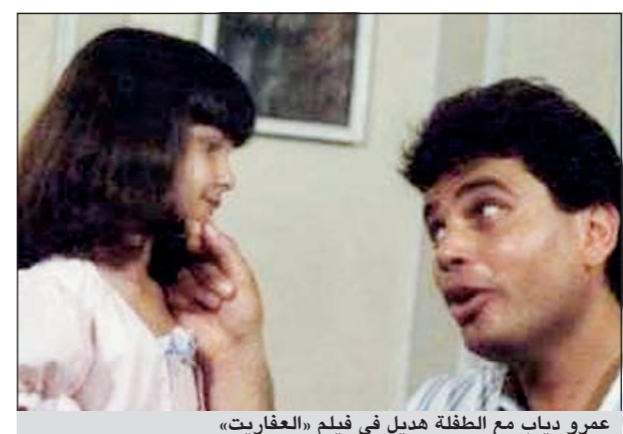
عمرو دياب مع الطفلة هديل في فيلم «العفاري»