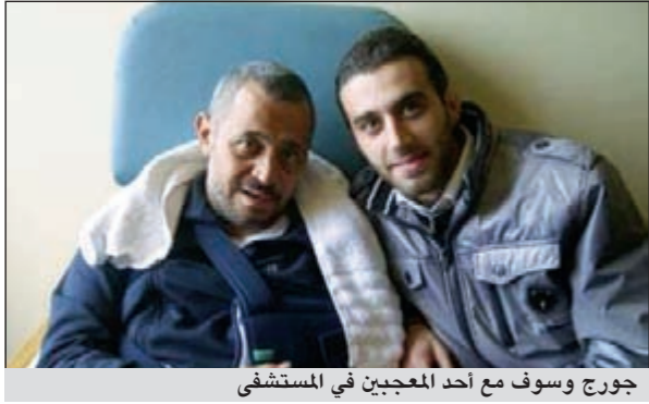
جورج وسوف مع أحد المعجبين في المستشفى

وسوف إلى السويد لاستكمال العلاج قد تم إلغاؤه، بسبب الصعق.