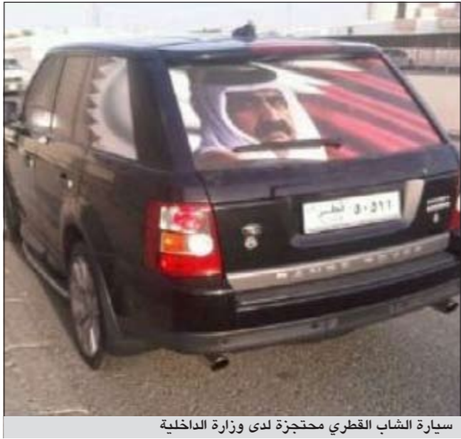
سيارة الشاب القطري محجزة لدى وزارة الداخلية

أكد أن المدهوس قذف القطري ببالونة مياه وتبادل والمتهم الضرب