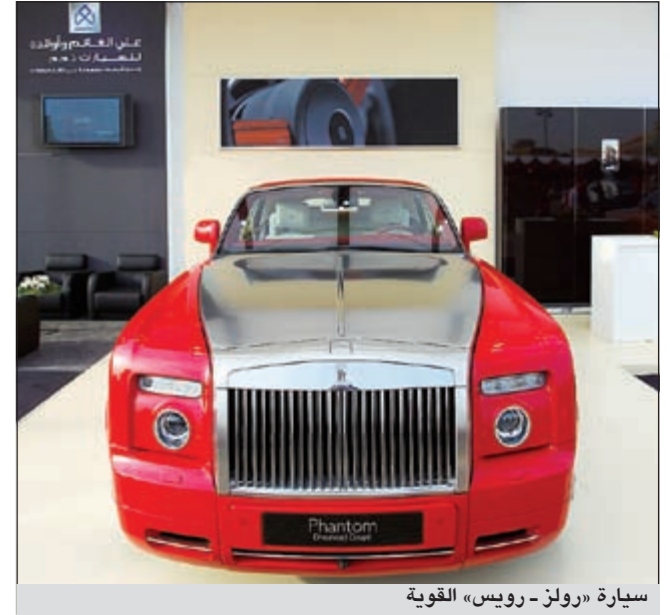
سيارة «رولز-روييس» القوية

وعملاتها المميزين. وقد فازت سيارة «سيلفر جوست 1924»، المرموقة في فئتها من السيارات التي يعود تاريخها إلى الفترة ما بين 1910 و1930. يذكر أن ملكية هذه السيارة العريقة تعود إلى سمو أمير باهالويلور، وقام بإعارتها محمد علي جناح والورد لويس مونتباتن آخر نائب ملك الهند، لنقلها إلى مبنى برلمان الهند في 14 أغسطس 1974 حيث تم الإعلان رسميا عن دولة باكستان. وتمتاز هذه السيارة باحتوائها على محرك سلس سعة 7,4 لترات وقوة 48,6 حصانا بست أسطوانات وعلبة تروس باربع سرعات. وأضاف الغانم في تعليقه على فوز سيارة «سيلفر جوست» بجائزة الأفضل في فئتها قائلا: «يشرفنا فوز سيارة «سيلفر جوست 1924»، كأفضل سيارة في فئتها. وما لا شك فيه أن المكائنة المميز التي تجسدها «رولز-روييس موتور كارز»، ليست وليدة اليوم بل هي حصان تاريخ طويل من الإنجازات والتميز، نقلت خلاله كبار شخصيات المجتمع إلى أهم المناسبات التاريخية الخالدة، وهي مستمرة في تولي هذا التقليد حتى يومنا هذا». وقال المدير الإقليمي لشركة «رولز-روييس موتور كارز»