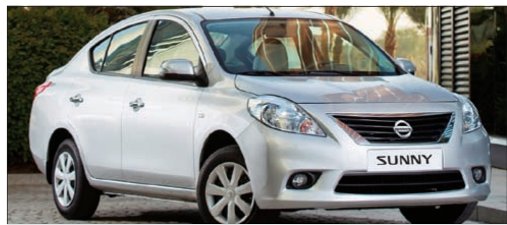
سيارة «صني» 2012 الجديدة

أما على الصعيد الميكانيكي، فتتوافر «صني» بمحرك من أربع