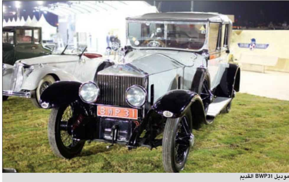
موديل BWP31 القديم

وتطل «ماكان» كخامس طراز في مجموعة بورشه، وهي بمثابة ركيزة رئيسية في «استراتيجية 2018»، القاضية بتوسيع رقعة طرازات الشركة. وتهدف بورشه إلى تحقيق نجاح باهر مع «ماكان» مماثل لما حققته مع طراز «كاين» الرائد. وسيبدأ هذا الطراز الجديد بالكامل في الخروج من خطوط الإنتاج في مصنع «لايبزيغ» في العام 2013. لهذه الغاية، وتم استثمار مبلغ 500 مليون يورو لتوسيع هذا المرفق الكائن في ولاية «سكسوني» وتحويله إلى مصنع إنتاج متكامل يتضمن خط تجميع للجسم ومرفق طلاء، وسيكون أحد أكبر مشاريع البناء في تاريخ بورشه، ما سيتيح للشركة استقطاب أكثر من 1,000 وظيفة