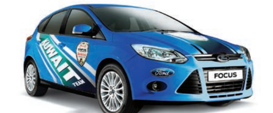
سيارة فورد فوكس

المشوقة... وسيتم اختيار الفرق النهائية في عملية مؤلفة من مرحلتين، حيث يتم في المرحلة الأولى التصويت من قبل الأصدقاء، وفي الثانية تقييم مهاراتهم. وسيكون باب التسجيل مفتوحا من 7 إلى 29 مارس 2012 أمام جميع مواطني دول مجلس التعاون الخليجي ممن يحملون رخص قيادة سارية المفعول. وذلك عن طريق صفحة فورد الشرق الأوسط على فيسبوك: www.facebook.com/fordmiddleeast .