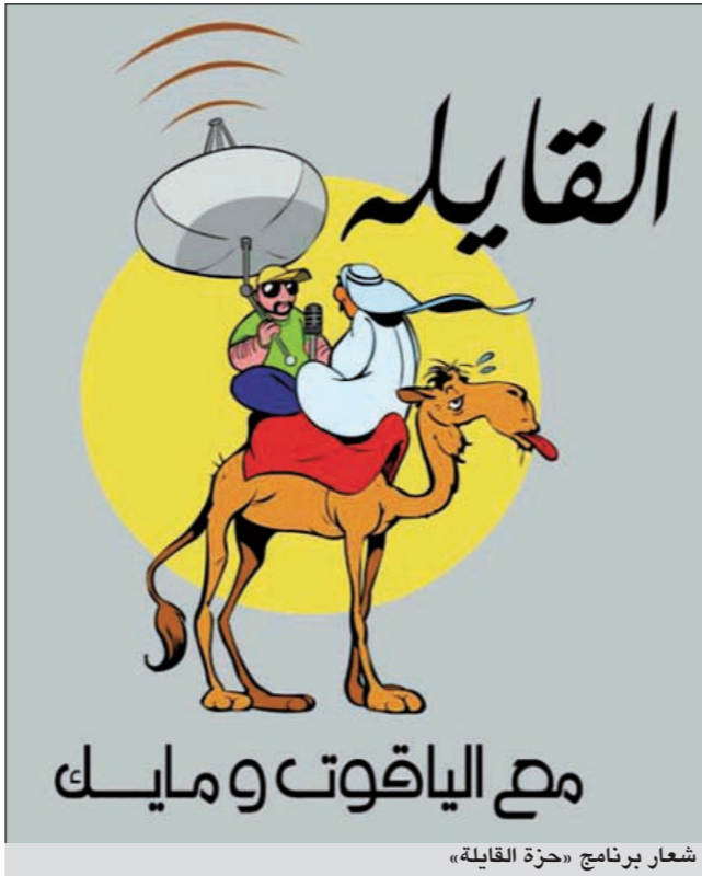
شعار برنامج «حزة القايلة»

من وزير الإعلام السابق الشيخ حمد جابر العلي. وفي السياق نفسه، تحدثنا إلى الإعلامي طلال الياقوت عن