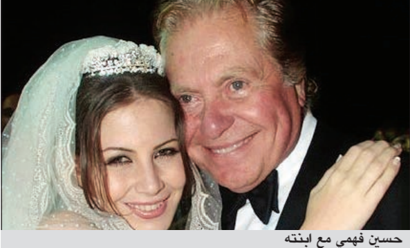
حسين فهمي مع ابنته

«رصد»: تمت خطوبة مئة ابنة كل من حسين فهمي وميرفت أمين على مدير علاقات عامة في إحدى الشركات المصرية، وأقيم الحفل داخل منزل العروس واقتصرت الحضور على الأهل والأصدقاء، ونأتى خطوبة مئة بعد شهر على طلاقها من الممثل المصري شريف رمزي بعد زواج دام ثلاث سنوات، ورفض الثنائي الكشف عن أسباب طلاقهما في وسائل الإعلام.