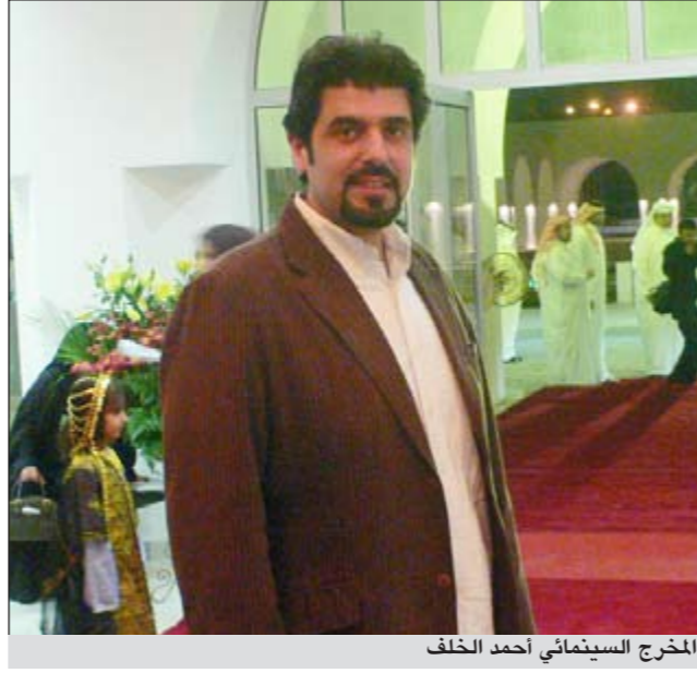
المخرج السينمائي أحمد الخلف

بعد الانتهاء من عروض الأفلام أقيمت ندوة للمخرج القدير خالد الصديق للحديث عن تكرياته في السينما ادارتها النجمة البحرينية فاطمة عبدالحليم، حيث تحدث الصديق عن تكريات الطفولة ومع والده، ونكر أن بداياته في السينما انطلقت منذ أوائل الستينيات عندما صور مظاهرات الكويتيين ضد عبدالكريم قاسم ومن بعدها قدم فيلم «المطرود» من تأليف عبدالأمير التركي وبطولة العملاق عبدالحسين عبدالرضا والفنان الراحل خالد النفيسي الذي عانى منه كثيراً بسبب عدم التزام الراحل خالد النفيسي والفنان عبدالحسين عبدالرضا بالنص المكتوب، حيث طلبا منه أن يبتلا بسجنيهما وليب طلبهما وبعد ذلك قدم فيلم «الصقر» الذي كان يتحدث عن الصقور والصيد بها وبعد ذلك تم تكليفه من المخرج المصري الراحل يوسف شاهين في أول زيارة له مع الراحل عبدالحليم حافظ للبلاد بتصوير بعض الأغاني بعد أن ذهب إلى وزير الإعلام الراحل الشيخ جابر العلي يستأذنه للمغادرة لتصوير فيلمه «بيع