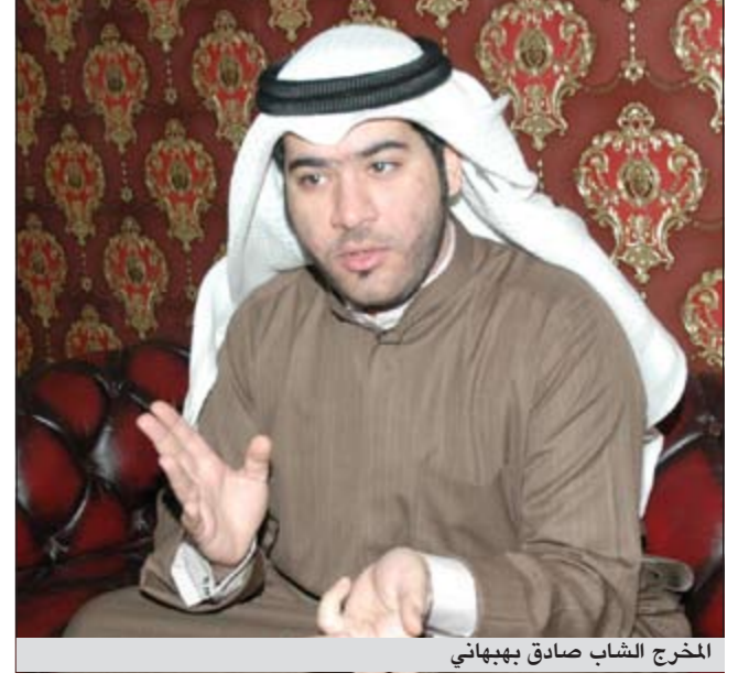
المخرج الشاب صادق بهبهاني