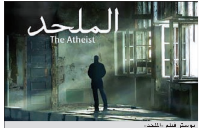
بوستر فيلم «الملحد»