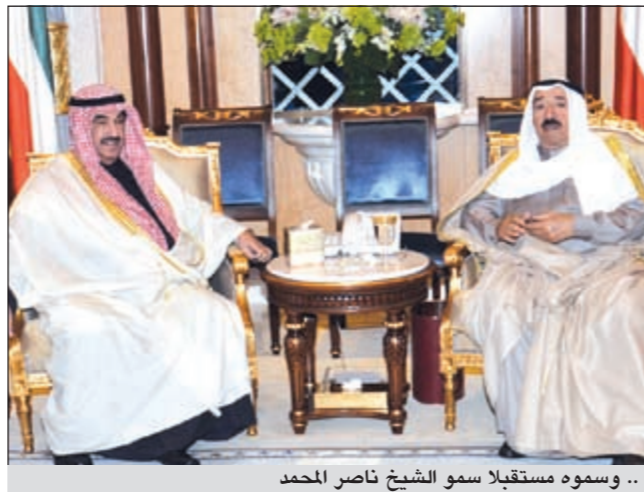
.. وسموه مستقبلا سمو الشيخ ناصر المحمد

بحث وفد اعلامي من جمهورية الشيشان في روسيا الاتحادية مع وكيل وزارة الاعلام الشيخ سلمان الحمود تعزيز التعاون الاعلامي المشترك بين البلدين الصديقين. وأكد الشيخ سلمان خلال اجتماعه مع الوفد الشيشاني امس انه يسعى نحو مزيد من التعاون بين الكويت وروسيا الاتحادية خاصة في مجال الاعلام لاسيما التعاون بين تلفزيون الكويت مع المحطات الاناعية والتلفزيونية في روسيا الاتحادية وبخاصة الشيشان. وأوضح الشيخ سلمان ان الوزارة تستعد لاقامة الاسبوع التعاوني الكويتي خلال