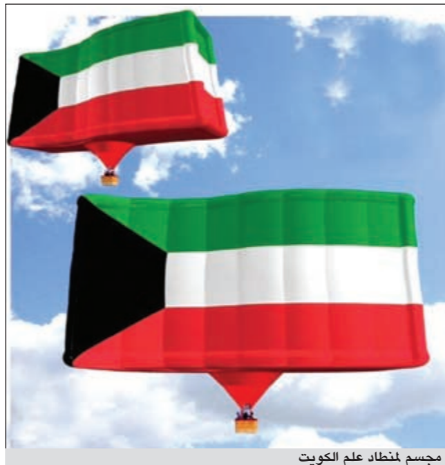
مجسم لمنطاد علم الكويت