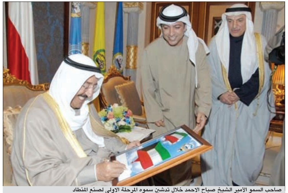
صاحب السمو الامير الشيخ صباح الاحمد خلال تدهن سموه المرحلة الاولى لصنع المنطاد