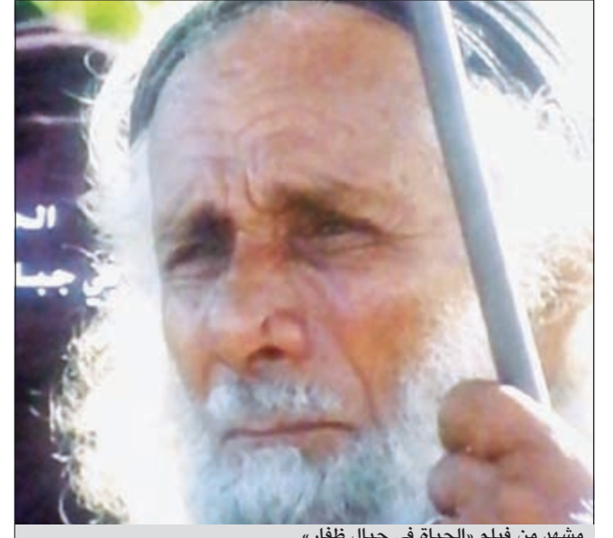
مشهد من فيلم «الحياة في جبال ظفار»

في اليوم الخامس لمهرجان السينما لدول مجلس التعاون الخليجي الأول عرضت سلطنة عمان الشقيقة على خشبة مسرح قطر الوطني ثلاثة أفلام سينمائية و«يوم سعيد» بينما الأخر وثائقي بعنوان «الحياة في جبال ظفار» وقد كانت الأراء النقدية حولها متفاوتة بين الإيجاب والسلب ولكن الجميع اتفق على الطفرة السينمائية الشبابية الموجودة في سلطنة عمان الشقيقة.