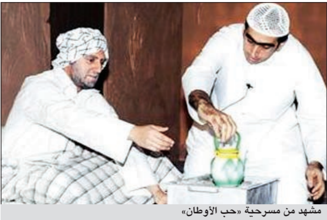
مشهد من مسرحية «حب الأوطان»