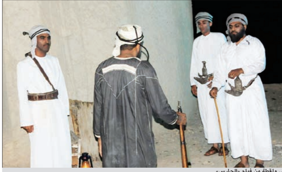
.. ولقطة من فيلم «الحارس»