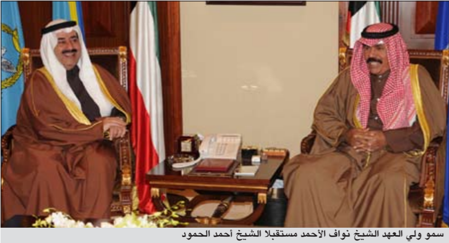
سمو ولي العهد الشيخ نواف الأحمد مستقبلاً الشيخ أحمد الحمود

استقبل سمو ولي العهد الشيخ نواف الأحمد بقصر بيان صباح أمس رئيس مجلس الوزراء بالإنابة ووزير الداخلية الشيخ أحمد الحمود.