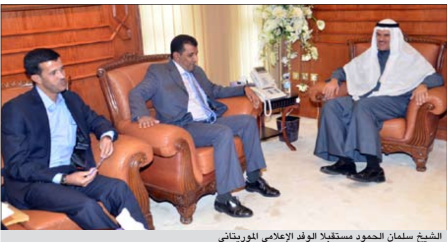
الشيخ سلمان الحمود مستقبلاً الوفد الإعلامي الموريتاني

بحث وفد اعلامي موريتاني مع وكيل وزارة الإعلام الشيخ سلمان الحمود تعزيز التعاون الإعلامي المشترك بين الكويت وموريتانيا. وأكد الحمود خلال اجتماعه مع الوفد الذي ضم المدير العام لوكالة أنباء نواكشوط محمد