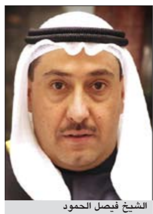
الشيخ فيصل الحمود

سبب وإساءة معاملة المحتجزين ومهاجمة أحياء مدنية ببنيران الديابات والبنادق الآتية بشكل عشوائي». وأوضح أن أوضاع حقوق الإنسان في سورية تدهورت بشكل ملحوظ منذ نوفمبر 2011 وأن