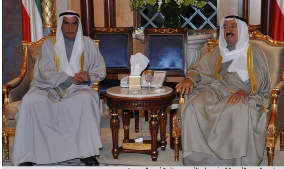
صاحب السمو الأمير الشيخ صباح الأحمد مستقبلاً أحمد السعدون

مارس المقبل. وأعلنت وزارة الخارجية اليابانية في بيان أصدرته أمس