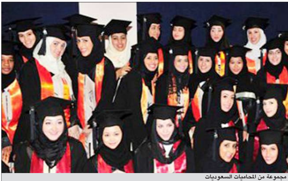
مجموعة من المحاميات السعوديات