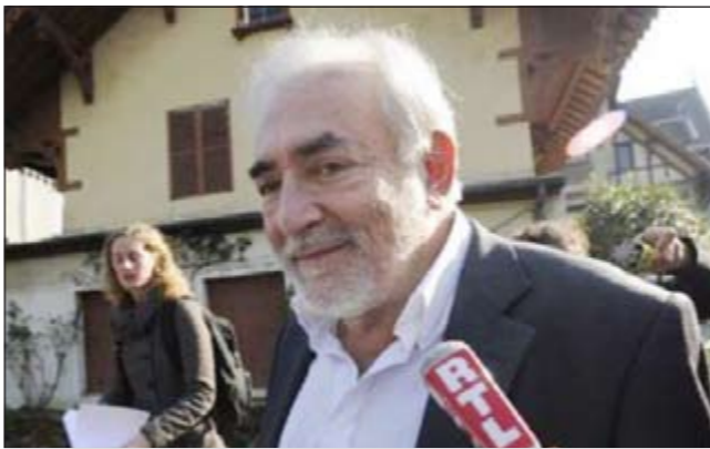
ستروس - كان

إيلاف: بعد أن كان محط إعجاب وتقدير الفرنسيين الذين رأوا فيه لأشهر عدة أنه رجل المرحلة بامتياز، والذي بإمكانه أن يخرج بلدهم من مستنقع الأزمة ليعيد لها لون الازدهار بتأكيد جميع استطلاعات الرأي، وبفارق كبير على منافسيه بمن فيهم الرئيس المرشح لولاية ثانية نيكولا ساركوزي. وبعد مرحلة النجومية في عالم الاقتصاد والسياسة، يجد دومينيك ستروس - كان نفسه في الدرك الأسفل من حميم المتابعات القضائية التي ستطول لسنوات، وذلك بسبب نزواته الجنسية المفرطة، والتي يؤدي فاتورتها، اليوم، غالباً من حياته المهنية ومن مساره العلمي والسياسي. عالم الاقتصاد المحك الذي استرعى اهتمام عدد من عوالم العالم نظراً لما توسمته فيه كخبير اقتصادي قادر على تدبير ملفات الاقتصاد العالمي بصفة مدير عام صندوق النقد الدولي، يتابع اليوم في قضية أخرى، ترتبط بمجونه الجنسي، في موازاة قضية فندق «سوفيتيل» المعروفة التي نحتة من على رأس إحدى أهم المؤسسات المالية الدولية في العالم. دومينيك ستروس - كان هو مطالب اليوم بإعطاء المزيد من