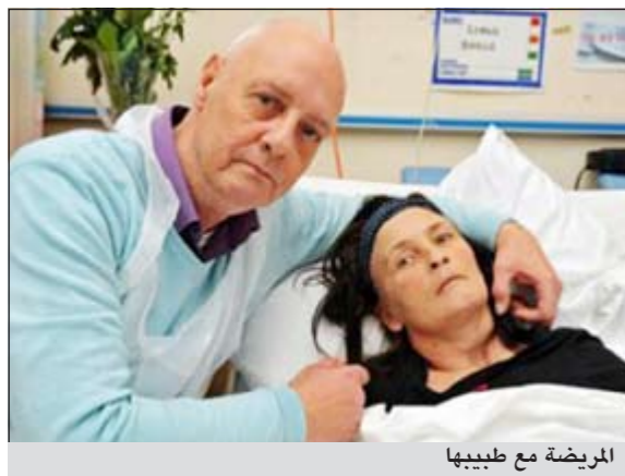
المریضة مع طبيبها