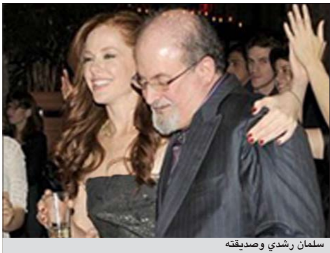
سلمان رشدي وصديقه

«ستيف تيش»، الذي أخرج فيلم «فورست جامب» المعروف، جندي بالذكر أن «سلمان رشدي»، الهندي المولد، البريطاني الجنسية، قد سبق له الزواج من قبل أربع مرات، آخرها من نجمة التلفزيون «بادما لاشمى».