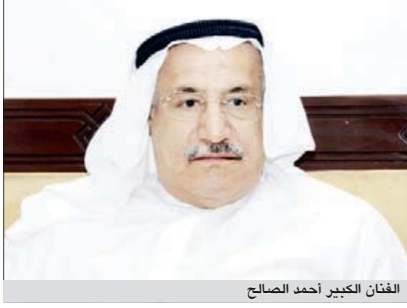
الفنان الكبير أحمد الصالح

صرح الفنان الكبير أحمد الصالح، بأن مسلسل «هوامير الصحراء» في جزئه المقبل سيكون مفاجأة للجمهور ويتخطى حواجز فكرة الأجزاء الروتينية، ويقدم حبكة درامية مميزة تختلف عما قدم في الجزئين الماضيين، ويخلق أحداثاً جديدة تضفي نوعاً من الإثارة وليس استكمالاً وعرضاً للأحداث القديمة. وأشار الصالح بحسب موقع «إيلاف»، إلى أن «هوامير الصحراء» يلقي الضوء على قضايا المجتمع المحلي الخليجي بكل ميزاته وعيوبه، ما جعل البعض ينتقد المسلسل نظراً لجرأته الزائدة في الطرح وكشفه المستور عن تلك العائلات فاقشة الثراء، والتي تبقى في النهاية تحتوي على مجرد أشخاص لديهم أحلام ومشاكل مثل الجميع، وهذا سر استمرار العمل.