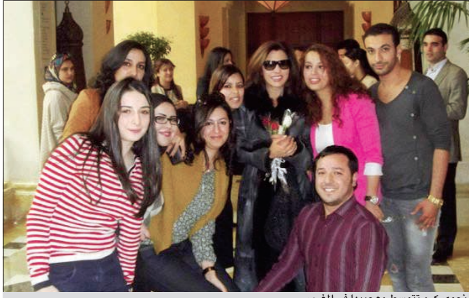
نجوى كرم تتوسط معجبيها في المغرب

استقبلت النجمة اللبنانية نجوى كرم تهاني خاصة بمناسبة عيد ميلادها الذي يوافق 26 فبراير، من جمهورها في المغرب، حيث أحييت حفلاً فنياً، السبت الماضي، لصالح منتج سيجي. وكان معجبو «فانز» المغرب الذين حضروا الحفل، قد فاجأوها بعد الساعة الثانية عشرة من منتصف الليل بمعاينتها، مغربين عن سعادتهم بأن تكون بينهم في اليوم الموافق لعيد ميلادها. وبدأت النجمة اللبنانية زيارتها إلى المغرب الجمعة الماضية، وحظيت باستقبال رائع من «الفانز»، فور وصولها المطار وفي بهو الفندق الذي أقامت به، وعبرت - عبر حسابها على موقع «تويتر» - عن سعادتها بهذا الاستقبال، كما وجهت الشكر إلى «فانز» نانسى واليسا الذين حضروا حفلها.