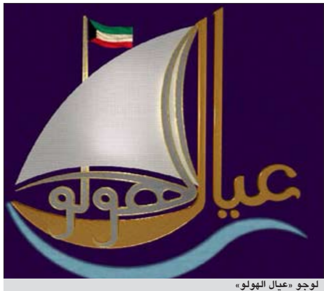
لوجو «عيال الهولو»