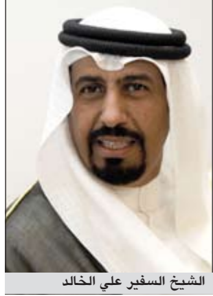
الشيخ السفير علي الخالد

الاقتصادية والقيام بعمليات الترويج السياحي. والكويت ولله الحمد تنعم بالاستقرار والامن وشعبها مضياف ومسالم ويستقبل الضيوف ويحتفي بهم بكل ترحاب، مشيراً إلى أن الكويت تعيش مناخاً ديمقراطياً يعطي صورة طيبة، وهي ليست جديدة على الكويت، فالكويت منذ قديم الزمان تمارس الحوار والديمقراطية والاختلاف في الرأي بصورة حضارية من خلال الديوانية فديوانيات الكويت منذ القدم برلمانات صغيرة يناقش روادها في كل القضايا بحرية كاملة، وقد تطورت حديثاً إلى مؤسسات ديمقراطية منتخبة بكل حرية وشفافية.