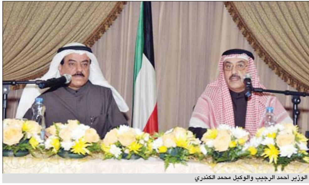
الوزير أحمد الرجيب والوكيل محمد الكندري

ما الأنشطة الخاصة بالمرحلة؟ ● هناك العديد من الأنشطة منها المشاركة بكل الفعاليات التي