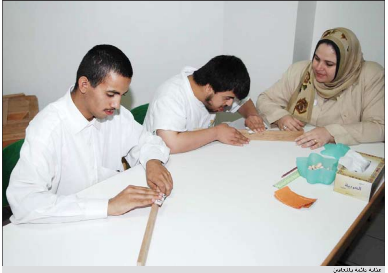
عناية دائمة بالمعاقين