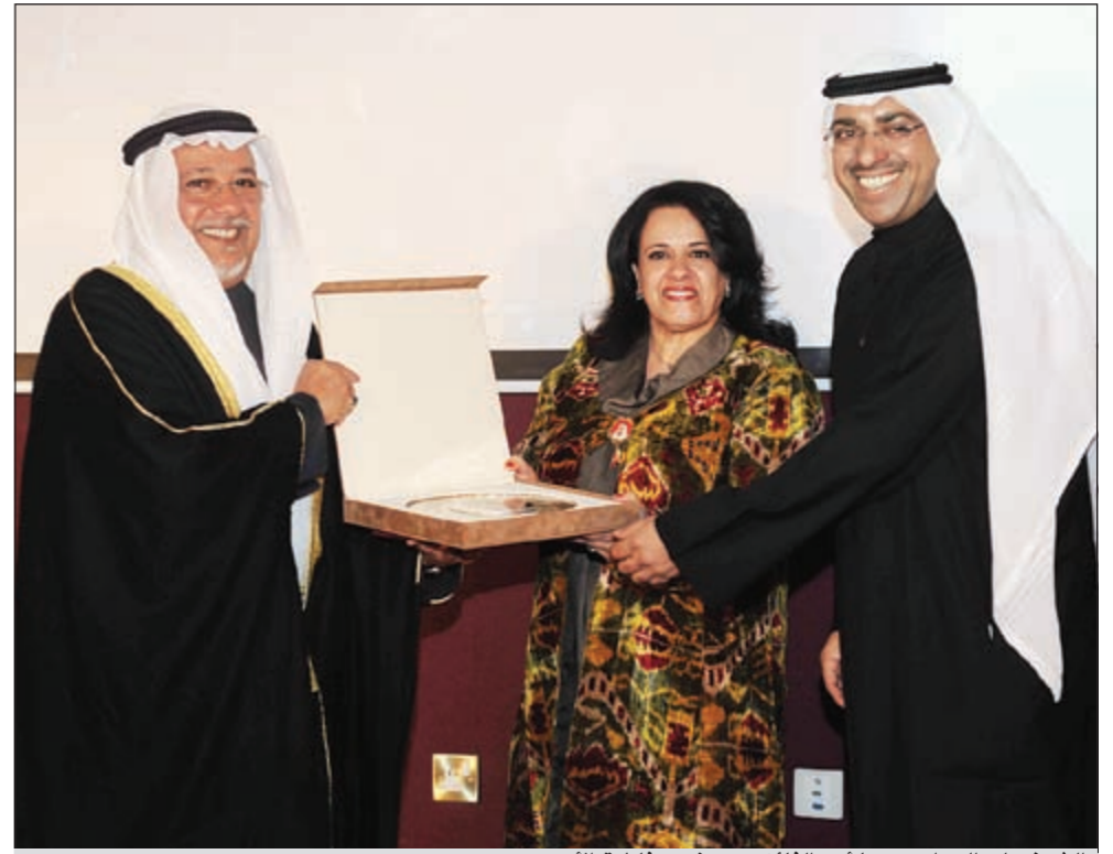
الشيخ علي الجراح مكرماً أحد الفائزين بحضور فاطمة الأمير

قائلة: أعطت الأفلام صورة واضحة عن الكويتي ومحبته كويتيين لبلادهم كما أنها مست قضايا الوطن المعاصرة التي عبرت فيها عن روح المحبة التي يحملها الشباب. وأضافت: الفن السابع اختير ليكون الوسيلة التي عبر بها كثير من أبناءنا عن مفاهيمها، وقد حوت الأفلام فسي طياتها الكثير من العبر والكثير من المظاهر المعاصرة التي تمس المجتمع الكويتي وقد قدمنا مجموعة من التوصيات التي مكتب الشهيد أو لاها أن تكون الاحتفالية سنوية وفانيتها أنه يجب تجسيد ثقافة حب الوطن لأن المواطنة من الأمور التي يجب ان تعطى اهتماماً أكثر وأخرها طرح مجموعة من المفاهيم التي يجب ان يعنى بها الشباب. بعدها تم عرض الأفلام الثلاثة الأولى الفائزة ثم تكريم المحكمين وتكريم الفائزين والمشاركين ثم التقطت صورة تذكارية للمجمع.