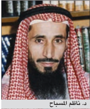
د. ناظم المسباح

«انبذوا الفرقة والطائفة وعودوا إلى أحضان الوطن» بهذه الكلمات وفي ذكرى يومي التحرير والاستقلال، أكد الداعية الإسلامي الشيخ د. ناظم المسباح أن الواجب علينا في مثل هذه الأيام أن نشكر الله على نعم الأمن والاستقلال والاستقرار من خلال العمل بأوامره واجتنب نواهيه مذكرا بقوله تعالى «الذين إن مكناهم في الأرض أقاموا الصلاة وآتوا الزكاة وأمروا بالعرف ونهوا عن المنكر»، مشيراً إلى أنه يمكننا أن نطلق على هذه المناسبة يوم التحرير أو اليوم الوطني وذلك للعتلة والذكرى والتذكرة أما لفظ العيد بالمعنى الشرعي فلا يطلق إلا على عيدي الفطر والأضحى، مشدداً على