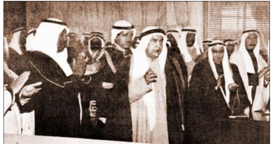
الوزراء وأعضاء المجلس التأسيسي يجيئون الشيخ عبدالله السالم