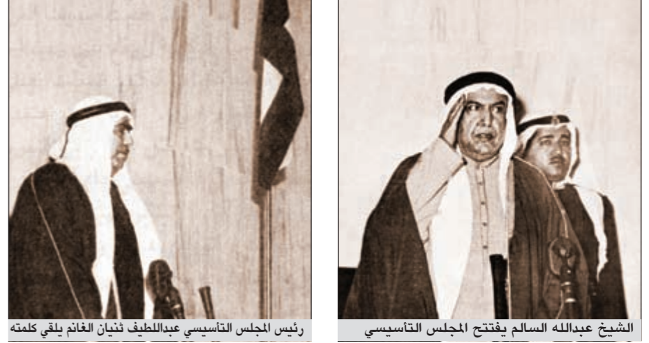
رئيس المجلس التأسيسي عبداللطيف نزيان الغانم يلقي كلمته