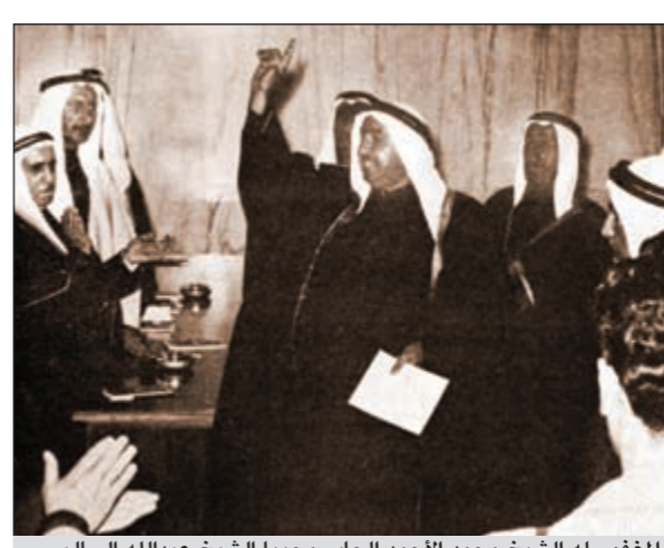
المغفور له الشيخ محمد الأحمد الجابر محييا الشيخ عبدالله السالم