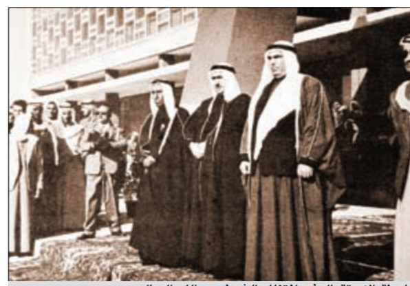
لجنة الاستقبال في انتظار الشيخ عبدالله السالم