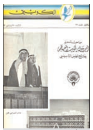
غلاف مجلة الكويتي