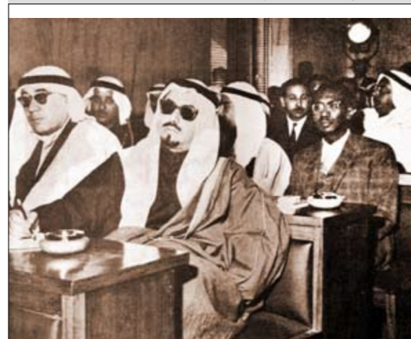
المغفور له سمو الشيخ جابر الأحمد