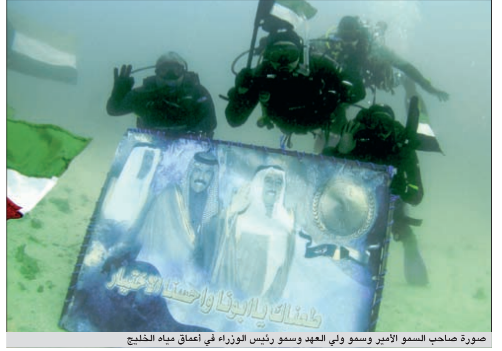
صورة صاحب السمو الأمير وسمو ولي العهد وسمو رئيس الوزراء في أعماق مياه الخليج