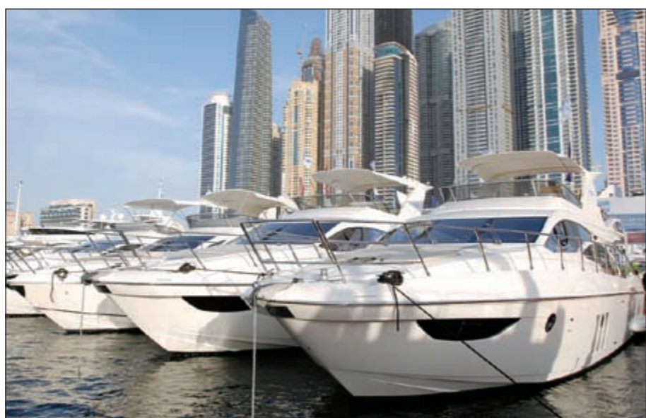
جانب من القوارب المشاركة في المعرض