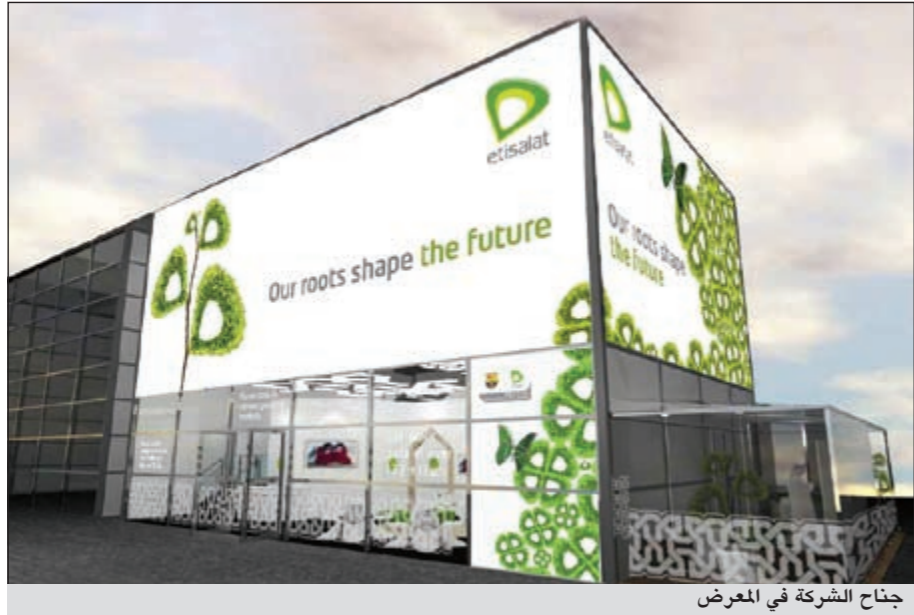
جناح الشركة في المعرض