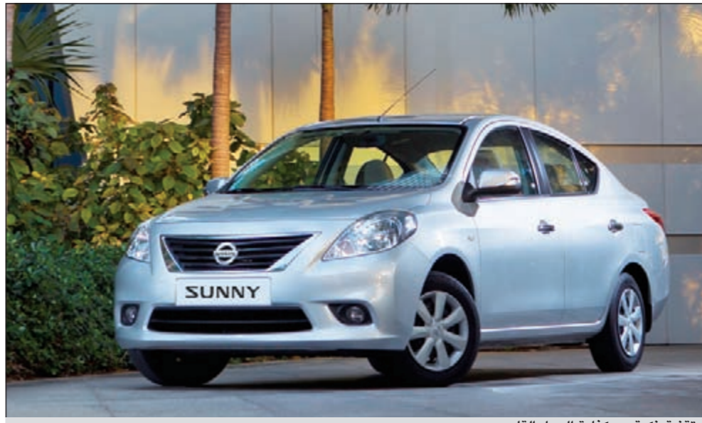
تقنية ذكية مع كفاءة الجيل القادم

كما أن تصميم صندوق الأمتعة يركز على استخدام المساحة، ويأخذ بعين الاعتبار كل شيء من حجم المفاصل إلى شكل الجدران الجانبية، كما تم تعزيز المقصورة بمجموعة من الميزات المتقدمة والمتنوعة، وهي اختيارية وتشمل: نظام هاتساف بتقنية البلوتوث مع مفاتيح للتحكم مدمجة على عجلة القيادة ومروحة تكييف خلفية (الأولى ضمن فئتها) ومصباح انعطاف مدمجة على مرايا الأبواب وحساسات خلفية لركن السيارة. إضافة لذلك، تمت مناقشة أفكار جديدة بين المصممين وفريق الهندسة في المراحل التأسيسية بهدف تأمين أقصى درجات العملائية. فعلى سبيل المثال، لا يمثل