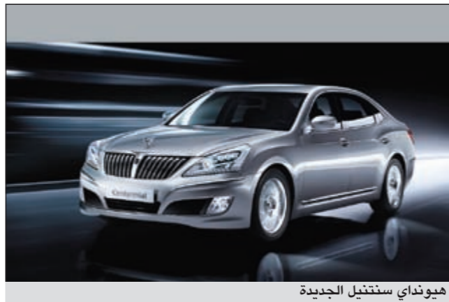
هيونداي ستنتيل الجديدة

4,06 ملايين سيارة حول العالم، وذلك نظرا للالتزام الكبير بتحسين جودة مجموعة سياراتها العصرية والمتطورة، يحمل لي شهادة ماجستير من جامعة