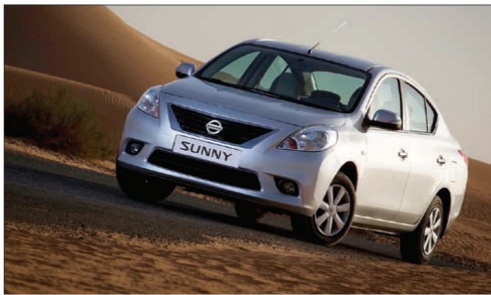
الجيل العاشر يتميز بشكل محدث ومقصورة بجودة عالية