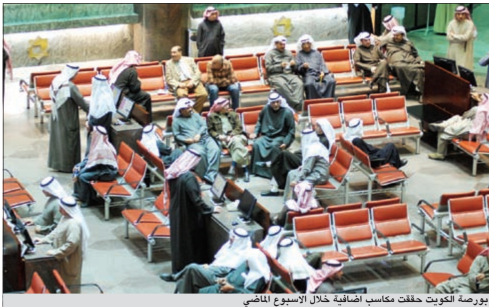
بورصة الكويت حققت مكاسب اضافية خلال الأسبوع الماضي

وبين أن بورصة قطر استقرت في المنطقة الخضراء في جلسات الأسبوع الماضي بعد أن تغلب مؤشرها على عمليات جني الأرباح التي حاولت أن تدفعه بتغيير مساره خلال فترة التداول، لينتهي تداولات الأسبوع على ارتفاع نسبيته 2,21٪ عند مستوى 8,732,75 نقطة. وحول سوق الكويت للاوراق المالية، قال التقرير انه حقق مكاسب اضافية خلال الأسبوع الماضي ليغلق على ارتفاع بوتيرة أعلى من تلك التي سجلها في النصف الاول من الشهر. وقد أثرت بالسوق إعطاء مهلة محددة لـ 9 شركات وشطب 9 شركات من السوق وإعطاء مهلة محددة لـ 9 شركات أخرى لتعديل أوضاعها، الأمر الذي دفع الجامع الي دعم أسهمها، ما ساهم بارتفاع نشاط التداول. هذا وأثارت التداولات العالية والمليارية التي انتعشت جراء المضاربة على الأسهم الرخيصة موجة من التفاؤل سلك السوق على أثرها المسار الصاعد شمل معظم أسواق المال في الفترة الاخيرة، ولكن يصاحب هذا التفاؤل قلقاً عند المستثمرين نظراً لافتقار الأسواق للمحفزات الحقيقية ومخاوفهم من انهيار الاسعار عند اقرب أزمة. ومع جملة المكاسب التي حققها السوق الكويتي خلال الأسبوع، اخترق المؤشر مستوى الـ 6,000 نقطة، منهيًا تداولات الأسبوع قبيل عطلة العيد الوطني عند 6,091,8 نقطة، بارتفاع أسبوعي نسبته 1,83٪.