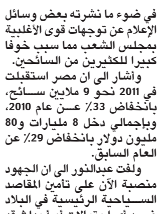
منير فخري عبدالنور

وأكد وزير السياحة المصري ان هناك خطة استراتيجية للمستقبل