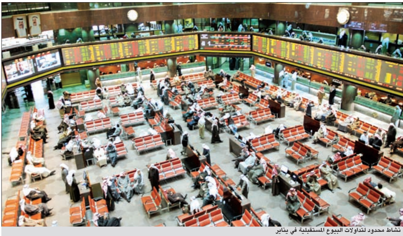
تشاط محدود لتداولات البيوع المستقبلية في يناير

بلغت القيمة الإجمالية للبيوع المستقبلية في سوق الكويت للأوراق المالية في شهر يناير الماضي 23,8 مليون دينار، وذلك بعد تداول 175,8 مليون سهم نفذت من خلال 694 صفقة تركزت بشكل مكثف في فترة الـ 3 أشهر.