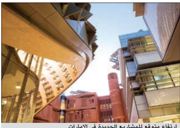
ارتفاع متوقع للمشاريع الجديدة في الإمارات

ويقام معرض عالم البناء المستدام بدعم من الشريك المؤسس، دائرة الشؤون البلدية، ومدينة المعارف المستدامة، مدينة مصدر، وبقاقران من مجلس أعمال الإمارات للتنمية المستدامة، والرعاى الاستراتيجي- مجلس الإمارات للمباني الخضراء والرعاى الرئيسي- حديد الإمارات.