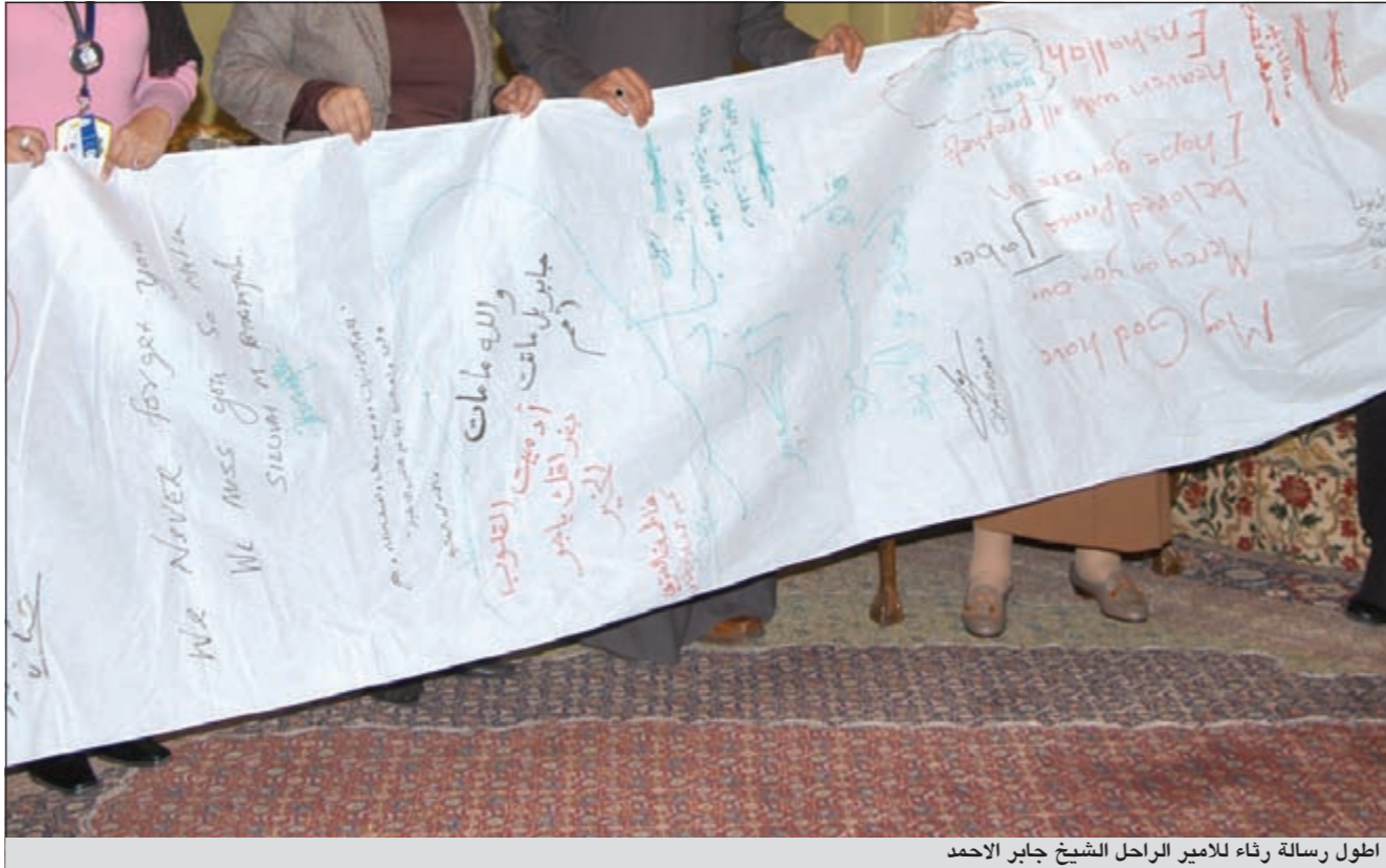
اطول رسالة رثاء للأمير الراحل الشيخ جابر الاحمد