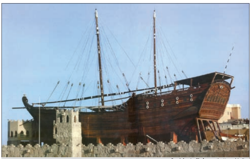
«الهامشي 11» أكبر سفينة داو خشبية