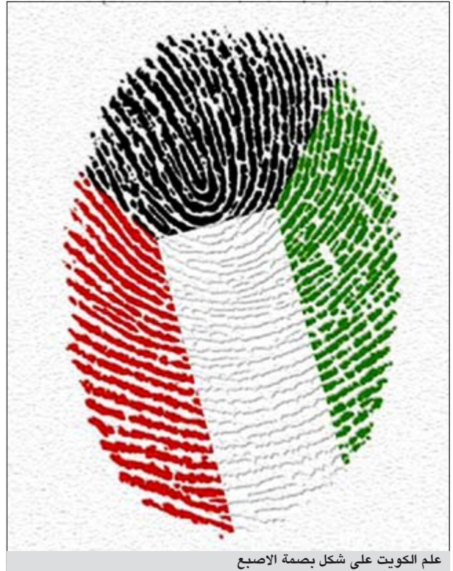
علم الكويت على شكل بصمة الاصبع

«الأبناء» ترصد أبرز الإنجازات الوطنية التي سجلت اسم الكويت في عالم التميز