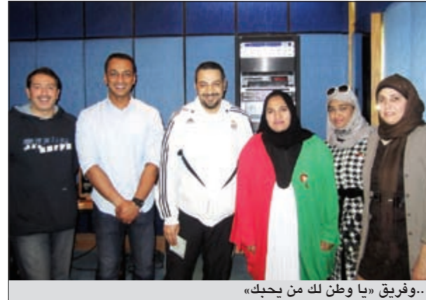
فريق «يا وطن لك من يحبك» و«عدي يا كويت»

مطربة توها طالعة من البيضة عطلت لحن موزع موسيقي قالتها انها هي مسويته بس بعد ما سمعا اكتشف انه مسروق من أغنية قديمة ولما واجهها بالشئ قالت يمكن توارد أفكار.. عجيب توارد أفكار وانتي موالي! التسعينيات شلون بصير!