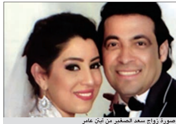
صورة زواج سعد الصغير من آيتن عامر