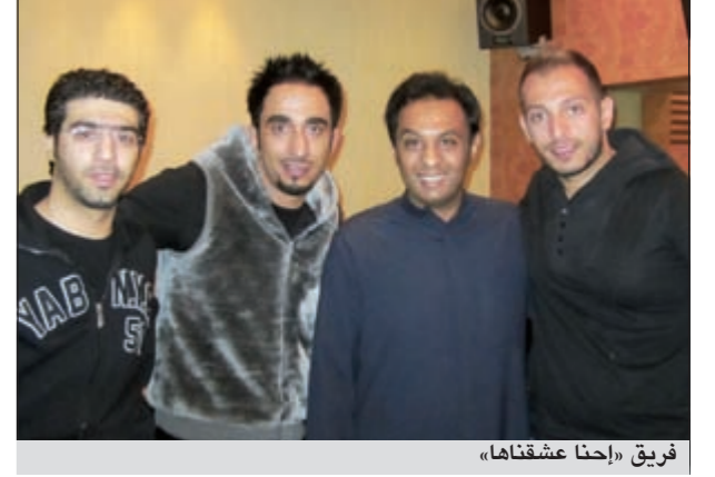
فريق «إحنا عشقناها»