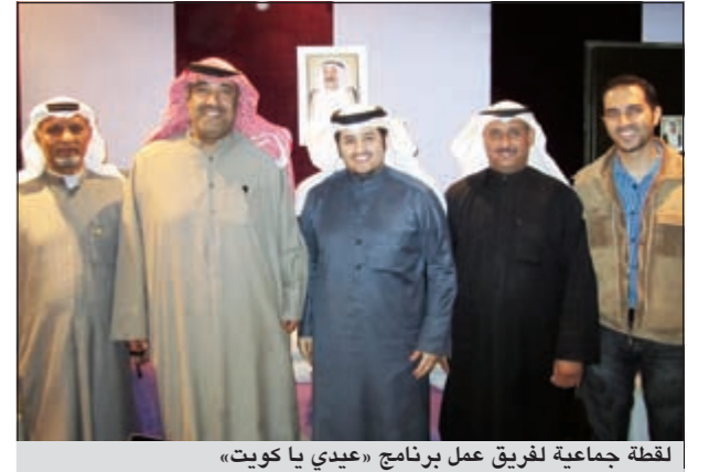
لقطة جماعية لفريق عمل برنامج «عدي يا كويت»