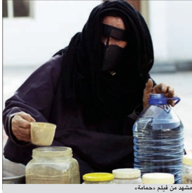
مشهد من فيلم «حمامة»

عبر المخرج القدير وعضو لجنة التحكيم للأفلام الروائية في مهرجان السينما الخليجي الأول هاشم محمد الشخص عن إعجابه بالفيلم الوثائقي الإماراتي «حمامة» لما تضمنه من جوانب إنسانية جميلة بتركيزه على حياة امرأة إماراتية تخدم البعيد قبل القريب وذلك بفضل الطاقة الموجودة عندها بعلاجهم بالطب الشعبي. وأوضح الشخص في مداخلة في ندوة الفيلم أن مثل هذه الأفلام تكون قريبة من قلب المتلقي خصوصا عندما تجد مخرجا متمكنا من أدواته ولذلك كان الفيلم قريبا من قلبي لأنه رجع بي إلى الوراء لأتذكر طبيباتنا الشعبيات في ذلك الزمن الجميل واللواتي كن يعالجن جميع الأمراض بالطب الشعبي. ونكر أن في الكويت مركز الطب الإسلامي الذي بناه العم الراحل خالد يوسف المرزوق طبيب الله ثراه والذي يجسد تقاليد العلوم الطبية القديمة المنمجة بالتكنولوجيا المتطورة ويضع علاجات فعالة وآمنة من الأعشاب ويقدمها للمرضى لعلاج خمسة عشر مرضا مختلفا.