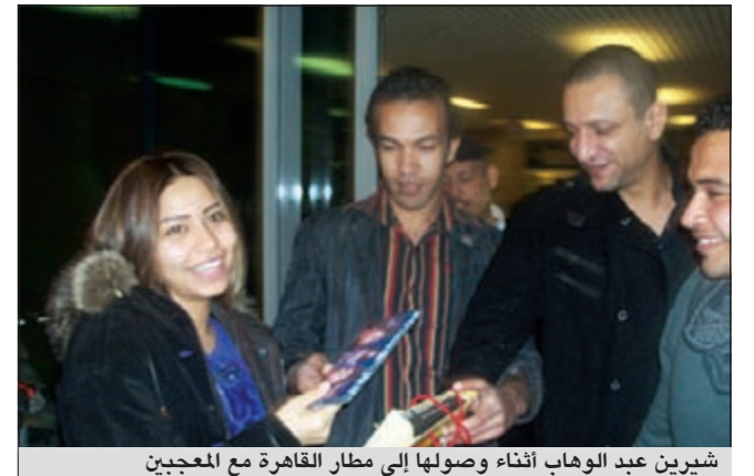
شيرين عبد الوهاب أثناء وصولها إلى مطار القاهرة مع المعجبين

فوجئت الفنانة شيرين عبد الوهاب بجمهورها ومحبيها عند استقبالها في مطار القاهرة فور عودتها من الكويت حيث قدمت حفلة ضمن «لبالي فبراير». فقد اتفق محبو النجمة المصرية، بحسب ما ذكرت «أنا زهرة»، على التوجه إلى مطار القاهرة لاستقبالها هناك وتهنئتها بالحفلة واليومها الجديد «أسأل عليا». بل قدموا لها هدية