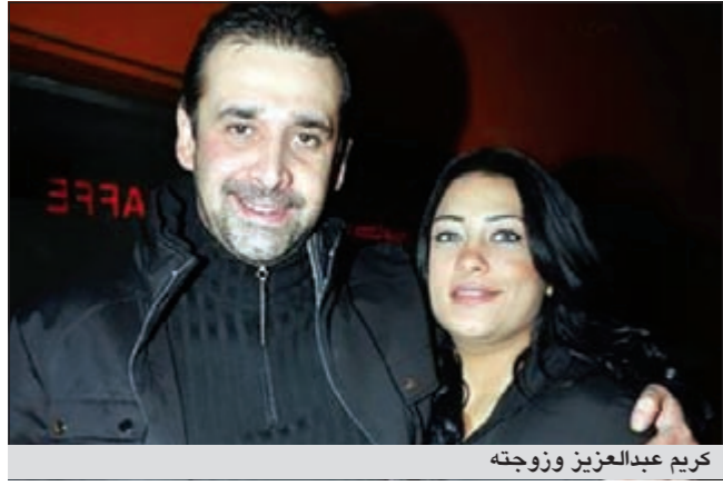
كريم عبدالعزيز وزوجته

وأشار كريم إلى أنه بمجرد أن يصل إلى الأراضي المقدسة سيدعو لمصر أن تمر من الكربة والأزمة التي تعيش فيها، وأن يحميها من أي ابتلاء، وأن تعبر هذه الأزمات على خير، كما سيدعو الله أن يدخل كل من سقط من أجل الحرية الجنة. وأوضح الفنان المصري أنه مشغول حاليا بتصوير مسلسله الجديد «الهرب» الذي يعود به إلى