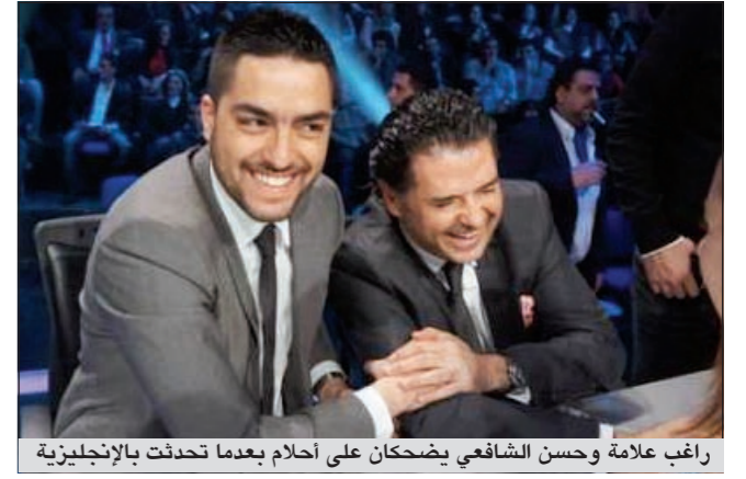
راغب علامة وحسن الشافعي يضحكان على أحلام بعدما تحدثت بالإنجليزية

الأولى باللغة الإنجليزية فقالت «You were great» ونسيت معناها بالعربية فرددتها بها راغب علامة: «أنت عظيمة»، ليسترسل بالضحك بعدها مع حسن الشافعي على هذا الموقف، فكانت نظرة حادة من أحلام لراغب، استكملتها بمشاركتها الضحك على نفسها.