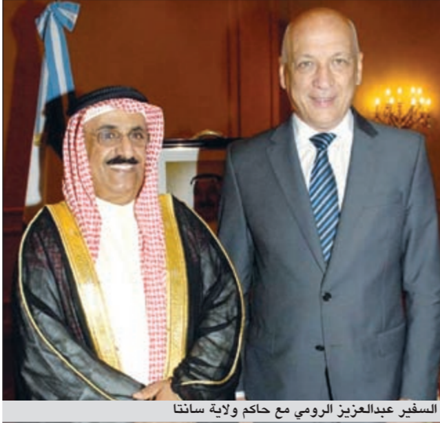
السفير عبدالعزيز الرومي مع حاكم ولاية سانتا