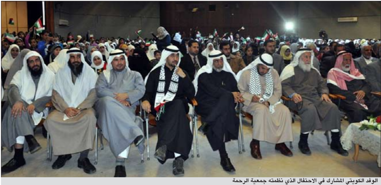
الوفد الكويتي المشارك في الاحتفال الذي نظّمته جمعية الرحمة

الامتين العربية والإسلامية والقادة العرب تحمل مسؤولياتهم تجاه القدس والأقصى. وتضمن الحفل عروضاً فنية متنوعة جسدت الواقع في قطاع غزة والمشاريع والمساعدين التي تقدمها دولة الكويت. وفي نهاية الاحتفال كرم بحر والوزراء والنواب المشاركون في الاحتفال الوفد الخيري الكويتي فيما كرم الوفد الكويتي خريجي مركز (الشفيق) لتحفيظ القرآن الكريم الذين اتموا حفظ كتاب الله عز وجل خلال عام 2011 والبالغ عددهم 126 حافظا لكتاب الله.