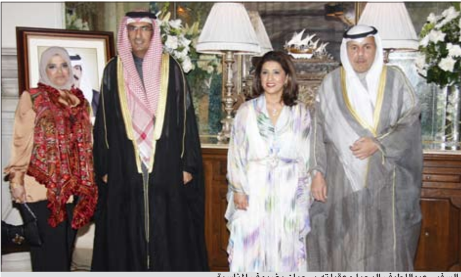
السفير عبداللطيف الجيحا وعقبته يرحبان بضيوف المناسبة

كما شارك في الاحتفال وزير الزراعة الكويتي غوستافو رودريغيز ونائب وزير الخارجية لشؤون المنظمات الدولية السفير ابيلا مورينو ومنسق شؤون الشرق الأوسط وشمال أفريقيا في الحزب ومستشار الشؤون العلمية في مجلس الدولة فيديل كاسترو ونائب وزير الخارجية لشؤون الشرق الأوسط وشمال أفريقيا السفير انريكي رودريغيز وكذلك رئيس جمعية الصداقة العربية-الكويتية في المعهد الكويتي للصداقة مع الشعوب البروفسور الفريد كمبرا.