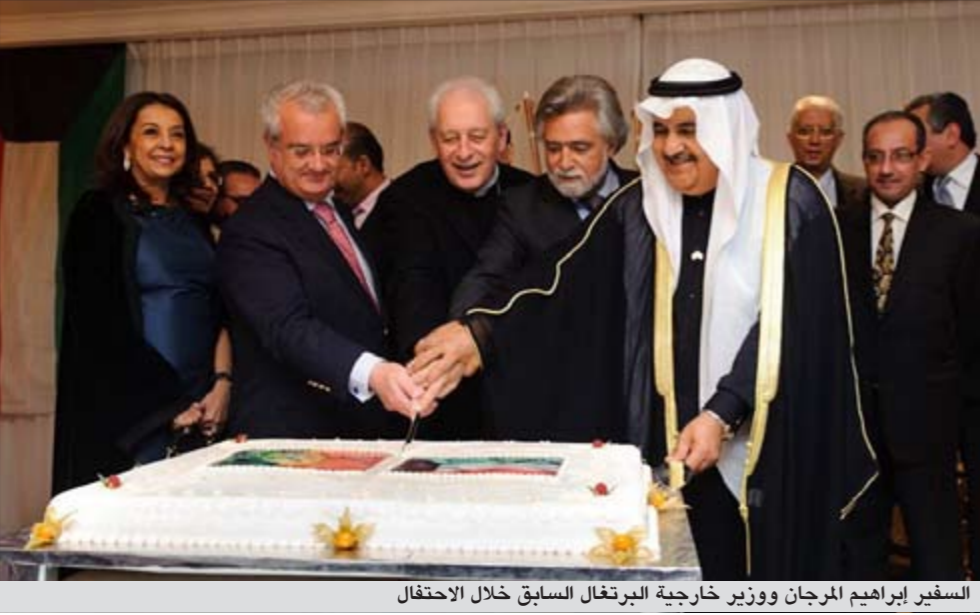
السفير إبراهيم المرجان ووزير خارجية البرتغال السابق خلال الاحتفال