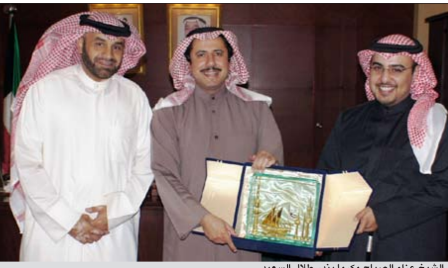
الشيخ عزام الصباح مكرما بندر طلال السعيد

تولي أبناءها الشباب كل الرعاية والاهتمام لما لهم من دور فاعل في بناء مستقبل مشرق للكويت في جميع الصعد. وأشار الى ان الكويت لديها كفاءات وطاقات شبابية قادرة على بناء مستقبل زاهر ومشرق كما ان القيادة السياسية بالكويت تدعم الطاقات الشبابية التي تبرز الوجه المشرق للكويت سواء في الداخل او في المحافل الخارجية.