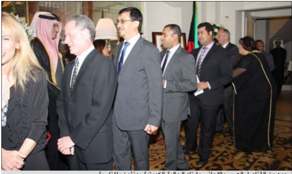
جمع من القناصل العرب والأجانب وبناء الجالية الكويتية يهنئون بالمناسبة