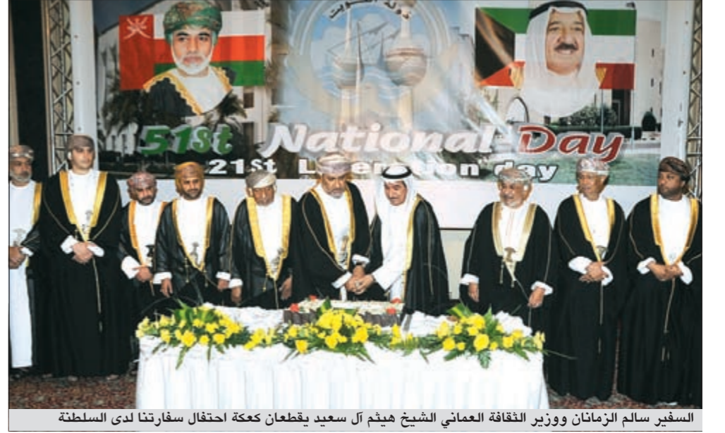
السفير سالم الزمان ووزير الثقافة العماني الشيخ هنيح آل سعيد يقطعان كعكة احتفال سفارتنا لدى السلطنة

فصلا بين ما تعده الفخادق وما تم اعداده في البيت الكويتي لهذه المناسبة التي تعتبر عرفا وتقليدا للشعب الكويتي بكل ما تحمله من معاني الكرم والضيفة العربية. وفي اديس ابابا اقامت سفارتنا لدى اثيوبيا حفل العيد الوطني الواحد والخمسين وعيد التحرير الواحد والعشرين يوم الجمعة 24 الجاري في فندق شيراتون اديس ابابا. وقد حضر الحفل السفير فينيسا يمر مستشار نائب رئيس الوزراء ووزير الخارجية والسفير تكلا كبيدي مدير ادارة الشرق الاوسط بوزارة الخارجية الاثيوبية ممثلا عن الحكومة الاثيوبية. كما حضر الحفل كبار المسؤولين بالدولة ورجال الاعمال والشخصيات والسفراء العرب والاجانب المعتمدون لدى جمهورية اثيوبيا. وتخلل الحفل الأناشيد الوطنية للكويت وتم وضع ركن خاص يتضمن كتابات عن نهضة الكويت. وفي هذه المناسبة تقدمت السفارة باسمي آيات التهاني والتبريكات لصاحب السمو الامير وسمو ولي عهد الامير. متمنين للكويت كل تقدم وازدهار.