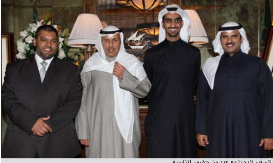
السفير الجيحا مع عدد من حضور المناسبة

كما أقام عميد السلك الدبلوماسي لدى تركيا سفيرنا بانقرة عبدالله الذويخ حفل استقبال حضره عدد من الوزراء الأتراك وأعضاء البعثات الدبلوماسية المعتمدة في أنقرة ووسائل الإعلام وعدد من كبار المثقفين والأكاديميين الأتراك والطلبة الكويتيين الدارسين في تركيا احتفالاً بالاعيد الوطنية. وأكد الذويخ لـ «كونا» على هامش الحفل أن العيد الوطني يمثل للجميع ما وصلت إليه الكويت من تقدم وازدهار وتطور في مختلف المجالات. وأضاف «أتمنى أن يدوم على شعبنا وبلدنا الأمن والاستقرار بفضل القيادة الحكيمة التي دأمتا توصلنا إلى بر الأمان».