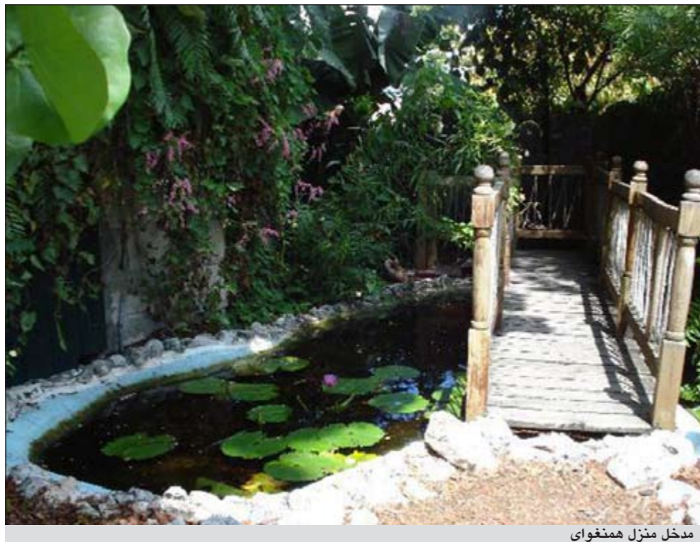
مدخل منزل همنغواي

إيلينوي - وكالات: يعرض منزل ترعرع فيه المؤلف والصحافي الأميركي ارنست همنغواي للبيع بسعر 525 ألف دولار. وأفادت صحيفة «شيكاجو صن تريبيون» الأميركية بأن وكيل عقارات عرض المنزل في «او ك بارك» للبيع، مشيراً الى ان مؤسسة «ارنست همنغواي» التي سسقت ان اشترت المنزل من مالك خاص في العام 2002، فكرت في استخدامه لاستضافة بعض الفعاليات لكنها تراجعت عن ذلك. وأشارت الى ان منزل والدي همنغواي كلارنس وغرايس هال همنغواي من تصميم المهندس هنري فيديك بالاشتراك مع والدة المؤلف، وقد سكنته العائلة في العام 1906. ولفتت الى ان همنغواي تعافى في هذا البيت من جروح اصيب بها خلال الحرب، وكتب عنه لاحقا في رواية «وداعا ايها السلاح».