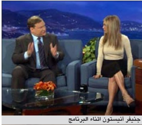
جنيفر أنيستون أثناء البرنامج

وكالات: حلت الممثلة الأمريكية جنيفر أنيستون ضيفة على برنامج Conan للترويج لفيلمها الجديد wanderlust وخلال الحلقة كشفت أنيستون (43 عاماً) انها خضعت لجلسة ليزر وقالت: قمت بشيء مثل التقشير، وكنت ابدو كضحية حريق لمدة اسبوع، وبعد ذلك بدأ الجلد على وجهي بالتساقط لمدة ثمانية أيام. وتابعت: كان الأمر مرعباً جداً، وتحدثت خلال الحلقة عن النجمة التي حصلت عليها مؤخراً في رصيف هوليوود، يذكر ان فيلم أنيستون سيطلق في السيتما يوم 24 فبراير 2012.