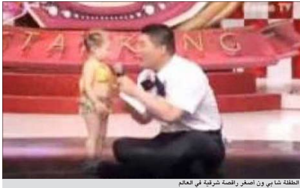
الطفلة شا بي ون أصفر راقصة شرقية في العالم

هي المرة الأولى التي تستضيفون فيها طفلة بحفاض؟».