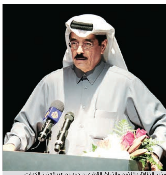
وزير الثقافة والفنون والتراث القطري د.حمد بن عبدالعزيز الكواري

وسلط حضور فني خليجي وعربي افتتح وزير الثقافة والفنون والتراث القطري د.حمد بن عبدالعزيز الكواري مساء أمس الأول مهرجان السينما الأول لدول مجلس التعاون لدول الخليج العربية الذي تحتضنه الدوحة في الفترة من 23 الجاري وحتى الأول من شهر مارس المقبل على خشبة مسرح قطر الوطني.