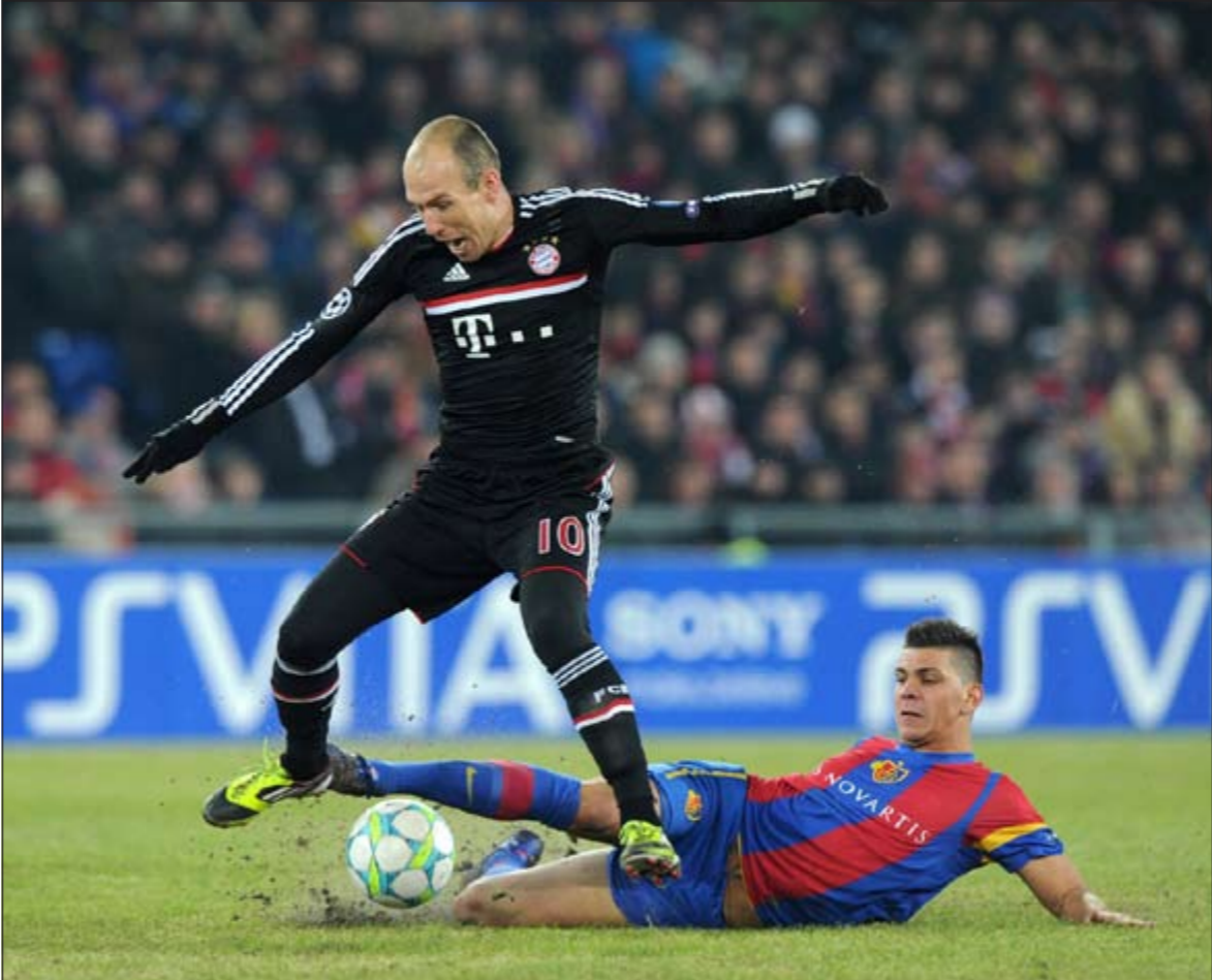
مهاجم بايرن ميونيخ اربين روبن يمر من مدافع بال غرانيت اكازا

نجح مرسيليا الفرنسي وبال السويسري في حسم الفصل الاول من مواجهةهما مع العملاقين انتر ميلان الايطالي وبايرن ميونيخ الألماني بالفوز عليهما بنتيجة واحدة 0-1 بالوقت القاتل في ذهاب الدور ثمن النهائي من مسابقة دوري ابطال اوروبا لكرة القدم.