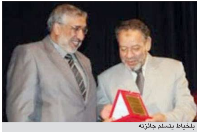
بلخياط يتسلم جائزته

أكد الأكاديمي د.عبد السلام بلاجي، وهو من مؤسسي العمل الإسلامي بالمغرب، أن الفنون حاجرة من الحاجات الفطرية للإنسان، حيث كانت حاضرة في السنة وفي حياة الصحابة وغيرهم من المسلمين. وأضاف القيادي الإسلامي، أن الإشكال الذي يطرح يكمن في طبيعة نظرة بعض المسلمين الدونية لقضية الفنون، موضحا أن الفنون وعاء يأخذ في الشرع حكما جسما يلازمه، حيث يمكن أن يعثرها حكم الإبادة كما يمكن أن يشمله حكم الكراهة