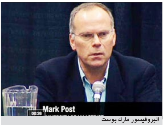
البروفيسور مارك بوست

أتلانتا-سي.ان.ان: إذا كنت ممن يعزفون عن تناول اللحوم يتنافى إنتاجها مع معتقدات دينية أو شخصية، وترفض في الوقت ذاته أن تصبح نباتيا، فالأمر قد أصبح سهلا بعدما أعلن عالم هولندي عن ابتكار لحم من الخلايا الجذعية.