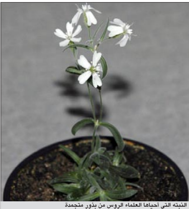
النبته التي احيائها العلماء الروس من بذور منجمدة

واستخرج العلماء ما يعرف بـ «نسيج المشيمة» من بذور غير ناضجة ووضعوها في محلول