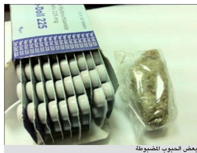
بعض الحبوب المضبوطة

أحبط رجال منفذ مطار الكويت الدولي محاولة تهريب مواد مخدرة ومؤثرات عقلية قدم بها وافدان من جنسية عربية الى البلاد صباح امس من وطنهم.