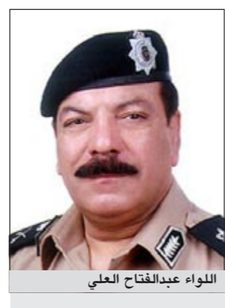
اللواء عبدالفتاح العلي

بمناسبة العيد الوطني وعيد التحرير أصدر وكيل وزارة الداخلية الفريق غازي العمر قراراً بالإفراج عن جميع أعضاء قوة الشرطة الموقوفين انضباطياً بالتوقيف الانضباطي اكتفاء بالمدّة التي قضاهما كل منهم، وذلك اعتباراً من يوم غد