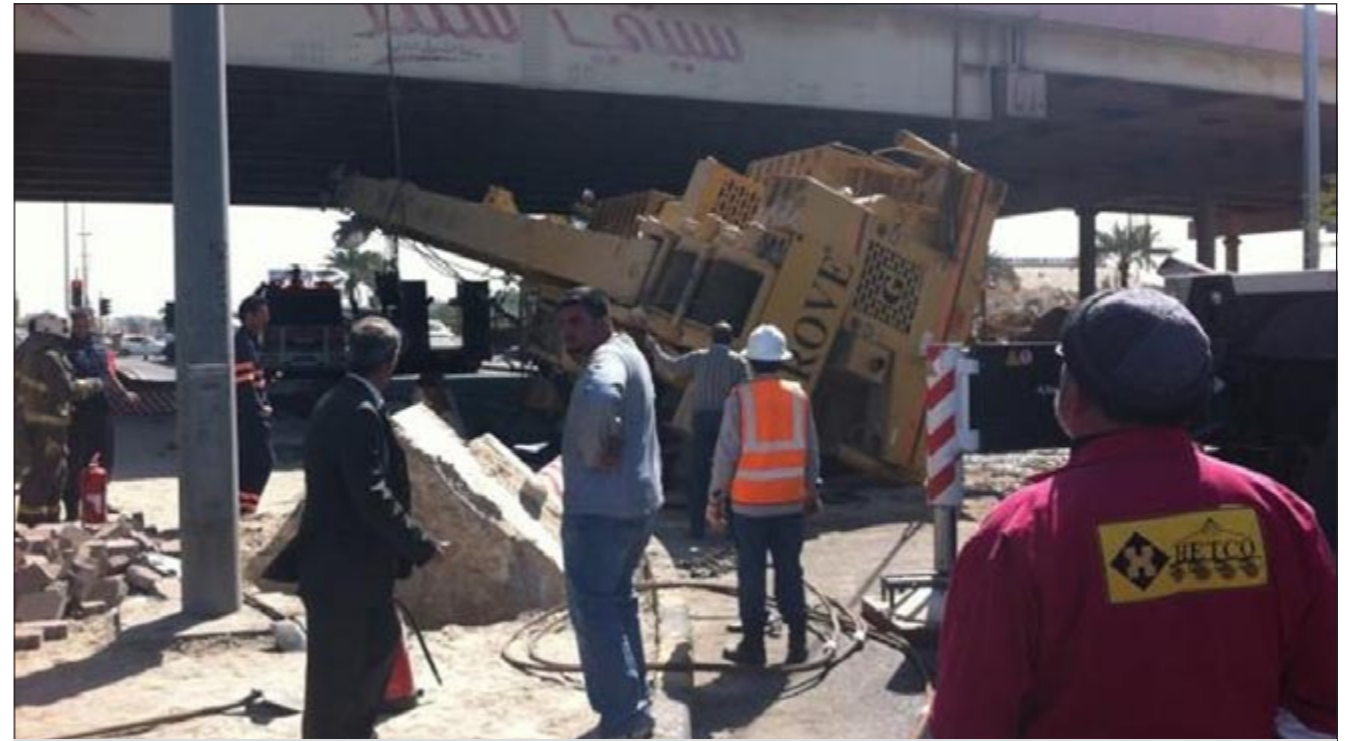
الكرين الذي شل الحركة في عدة طرق بالكويت

حلت ونحن لا نزال نحاول إزالة الكرين العملاق الذي تسبب في شلل تام للحركة المرورية بطول أكثر من 3 كيلومترات في بعض الطرقات كالدائري الرابع.