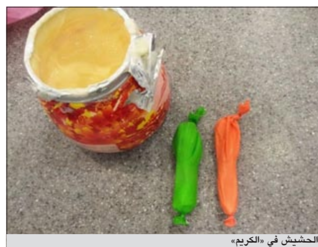
الحشيش في «الكريم»