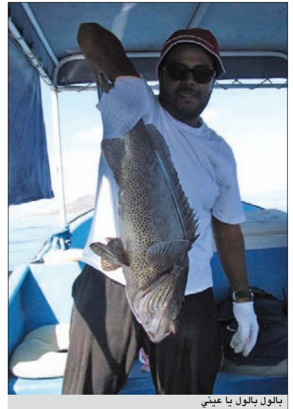
بالول بالول يا عيني