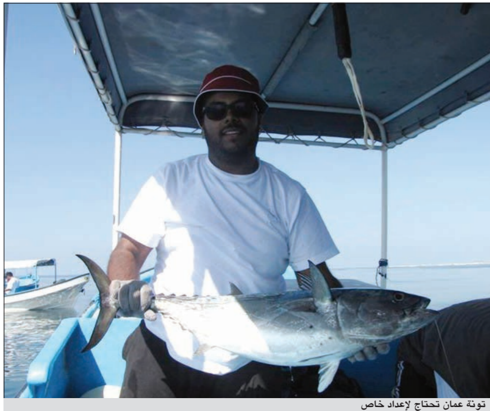
تونة عمان تحتاج لإعداد خاص

● نعم صحيح فالتطور قرب المسافات البعيدة من وسائل النقل