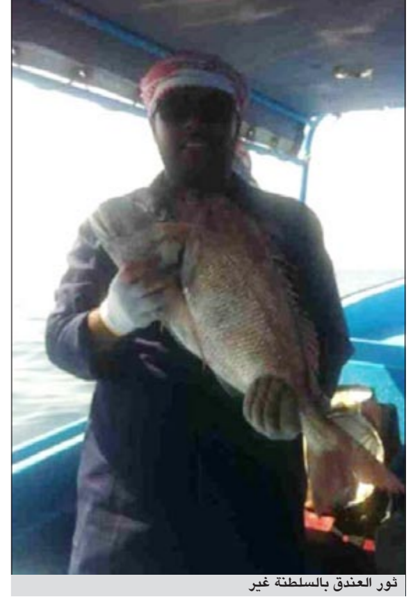
ثور العندق بالسلطنة غير