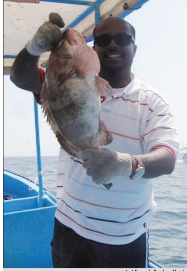
ياسلام على الهاصور الزين