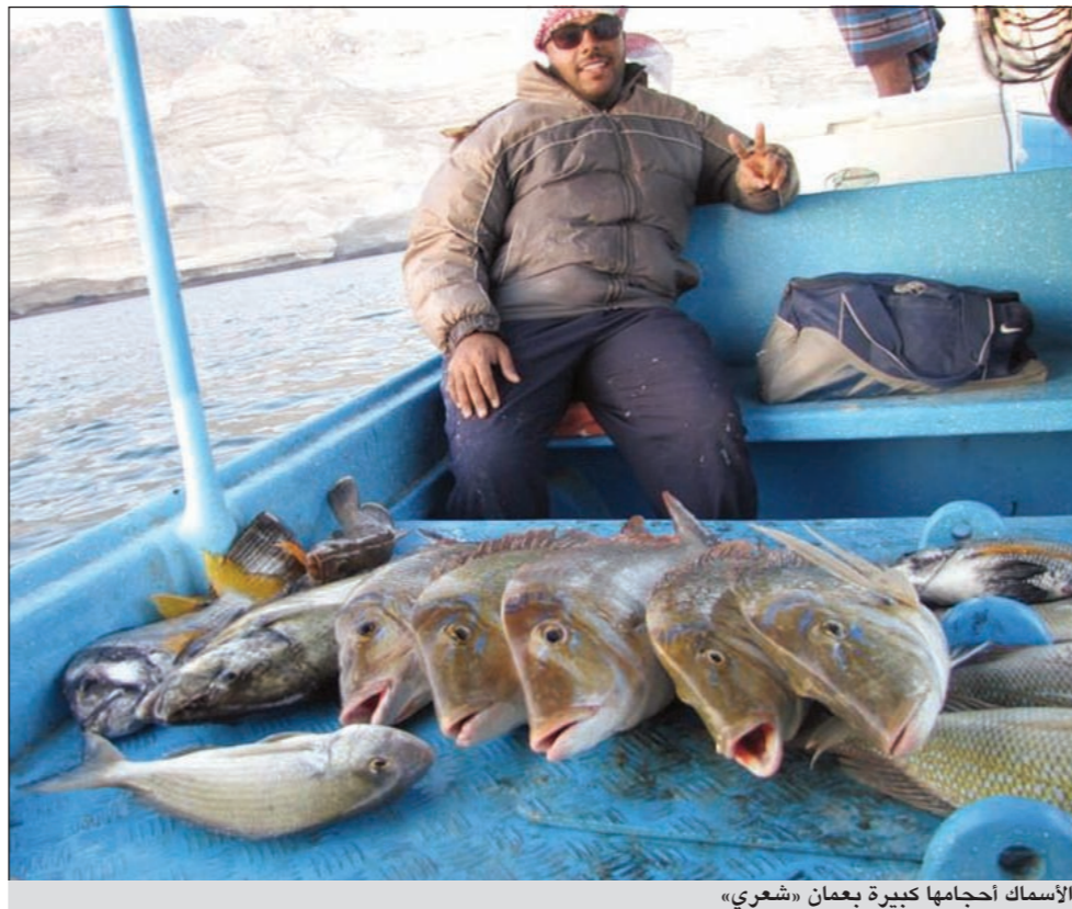
الأسماك أحجامها كبيرة بعمان «شعري»