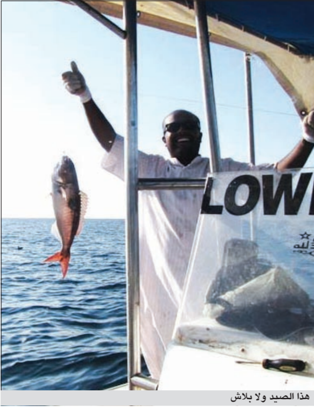
هذا الصيد ولا بلاش

● أوجه دعوتي الى آخواني الحدائق وأقول لهم حافظوا على ما تبقى من بحرنا واهتموا بعودة السلامة والإسعافات الأولية كاملة والحرص كل الحرص على حسبة المياه. وفي الختام، أتمنى لكل الصيد الوفير والسلامة.