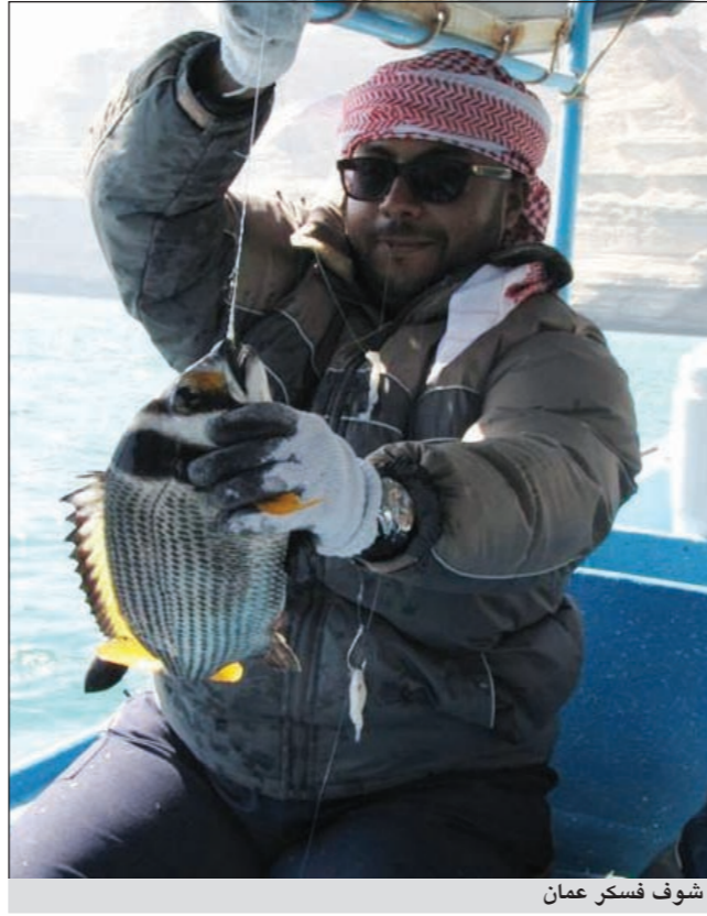
شوف فسكر عمان

بحر سلطنة عمان كبير وفيه عدة جزر ونسمع عنه ان كل منطقة صيد تكون أفضل من الأخرى فما أفضل مناطق الصيد هناك؟