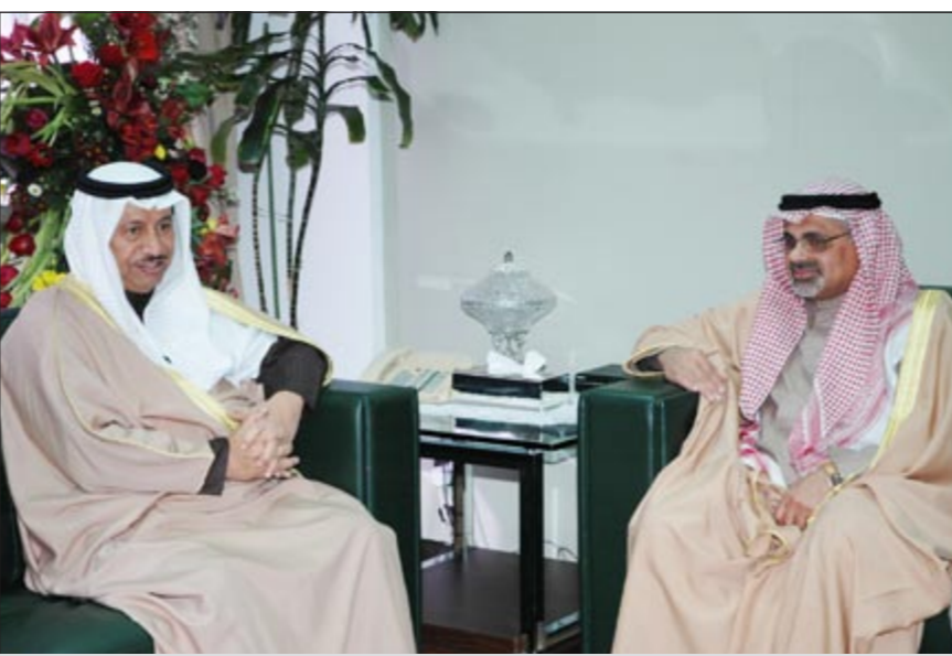
..وسموه في حديث مع الوزير جمال الشهاب