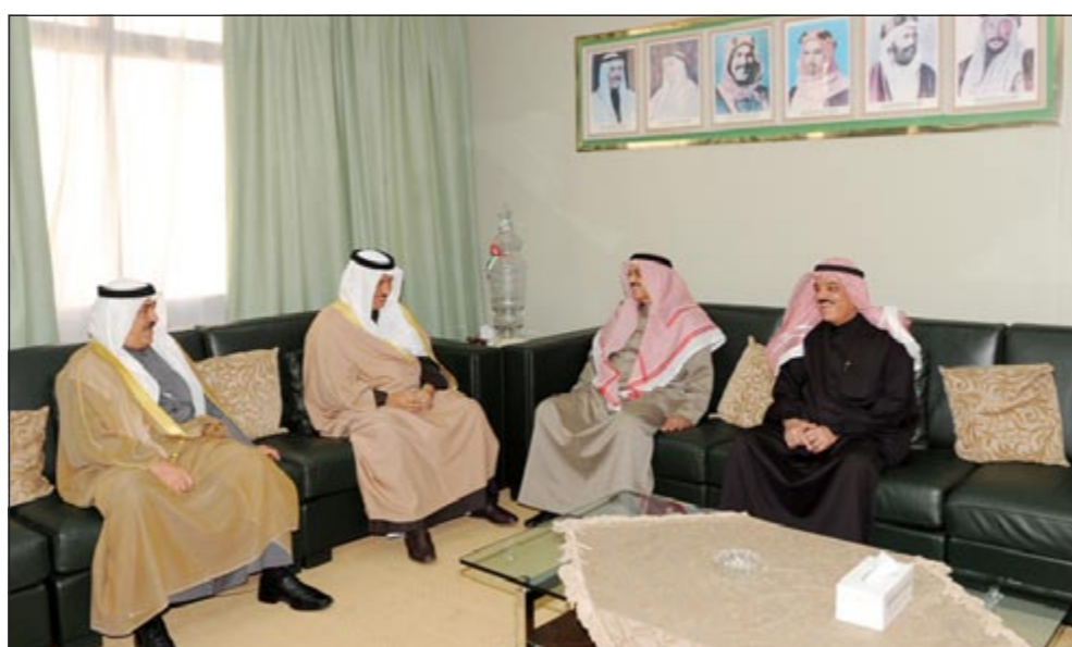
سمو الشيخ جابر المبارك مجتمعاً إلى الوزير أحمد الرقيب وأركان «الشؤون»

ودعا سموه القائمين على وزارة الأوقاف والشؤون الإسلامية إلى تفعيل الدور المرتقب في التوعية بتعاليم ديننا الإسلامي الحنيف بما يكرس المبادئ والقيم والأخلاق الإسلامية السمحة ويحقق التعاون والتكافل والتآخي بين المواطنين.