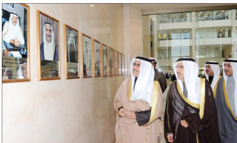
سمو رئيس الوزراء خلال تفقده معرضاً في وزارة الكهرباء

المسؤولين بوزارته حيث أشار إلى أن قضية الإسكان تعتبر في مقدمة أولويات الحكومة وطالب بالإسراع في تنفيذ المشاريع المدرجة ومعالجة مشكلة الانتظار الطويل للحصول على المساكن. وأشار سموه إلى أنه يدرك أهمية هذه القضية بالنسبة للمواطنين خاصة أبناءنا الشباب الذين يتطلعون إلى مستقبل واعد، مؤكداً أن الحكومة جادة في توفير الأراضي اللازمة في ضوء التوسع السكاني، مغرباً عن ثقته في أن التعاون