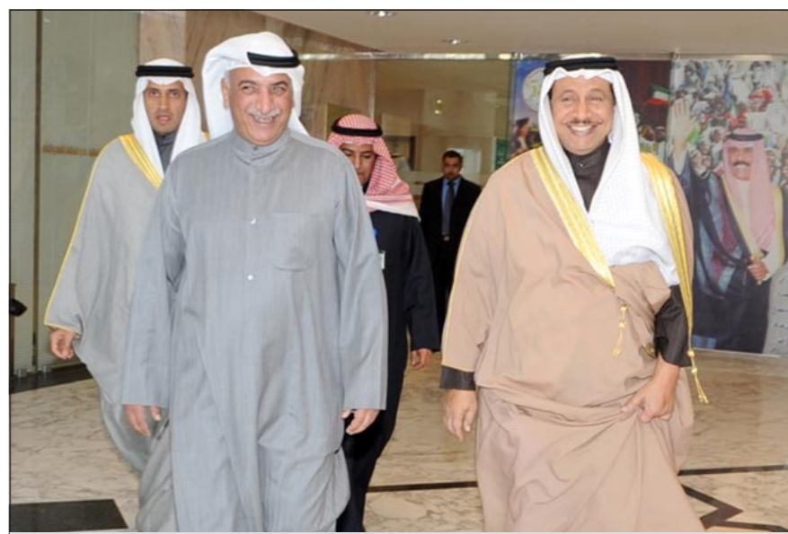
سمو الشيخ جابر المبارك لدى وصوله إلى المؤسسة العامة للرعاية السكنية وفي استقباله الوزير المويصري

جولته أشاد سموه خلال لقائه بوزير الأشغال العامة ووزير الدولة لشؤون التخطيط والتنمية. د. فاضل صفر وأركان الوزارة بالجهد الذي تقوم بها وزارة الأشغال في تنفيذ مشاريع البنية التحتية التي نعتبرها ركيزة أساسية في عملية الإصلاح الاقتصادي. ونبه سموه إلى ضرورة المتابعة الجادة لجميع المشاريع التي تشرف عليها الوزارة والحرص على تنفيذها وفقا للمواصفات المطلوبة التي تلائم الحاضر والمستقبل.