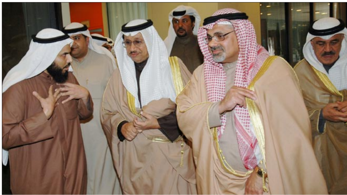
سمو الشيخ جابر المبارك مستمعاً لمداخلة خلال زيارته وزارة العدل