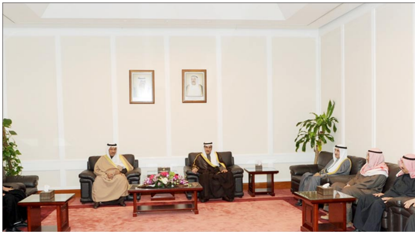
سمو رئيس الوزراء مجتمعاً مع وزير الكهرباء وقيادات الوزارة