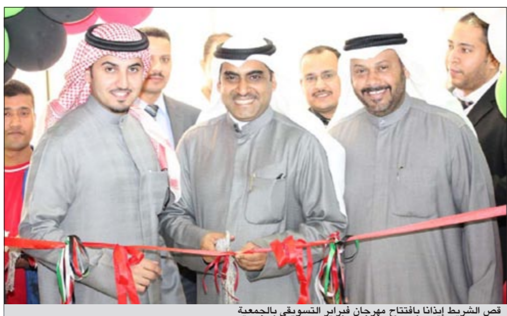
قص الشريط ايداناً بافتتاح مهرجان فبراير التسويقي بالجمعية