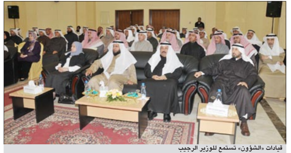
قيادات «الشؤون» تستمع للوزير الرجيب