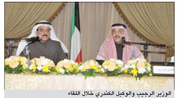
الوزير الرجيب والوكيل الكندري خلال اللقاء

كشف وزير الشؤون الفريق م. احمد الرجيب عن تحديد يومين في الاسبوع بعد الدوام الرسمي، يوم لاستقبال المراجعين واخر لاستقبال موظفي الوزارة ممن