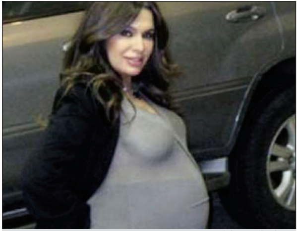
ريدا بطرس حاملاً

آخر اغنية قبل اعتزالها الفن نهائياً، رغبة منها في التفرغ لعائلتها الجديدة. يذكر أن الشقيقتين نينا وريدا بطرس اللتين شكلتا «ديو» فريدا من نوعه في عالم الغناء لمعتا معا قبل عدة سنوات.