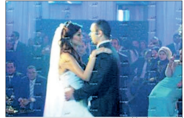
صورة من حفل زفاف روتانا