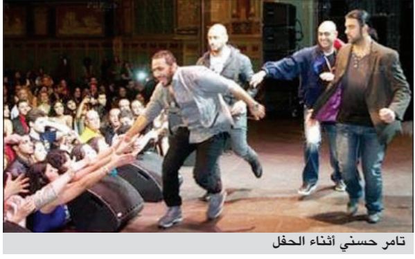
تامر حسني أثناء الحفل

أحياء الفنان تامر حسني حفلاً بمدينة «لوس أنجليس» في كاليفورنيا، وهو الحفل الرابع له في جولته الغنائية الأميركية، وجاء في بيان من المكتب الإعلامي لشركة «ماستر بيس» منظمة الحفل، حسب ما ذكر موقع «النشرة» أن حسني غنى بمسرح «باسادينا سيك»، وسط عدد كبير من الجمهور، وحرص على توجيه العزاء لشهداء مصر والوطن العربي، وطلب من الحضور الوقوف دقيقة حدادا على أرواح الشهداء.