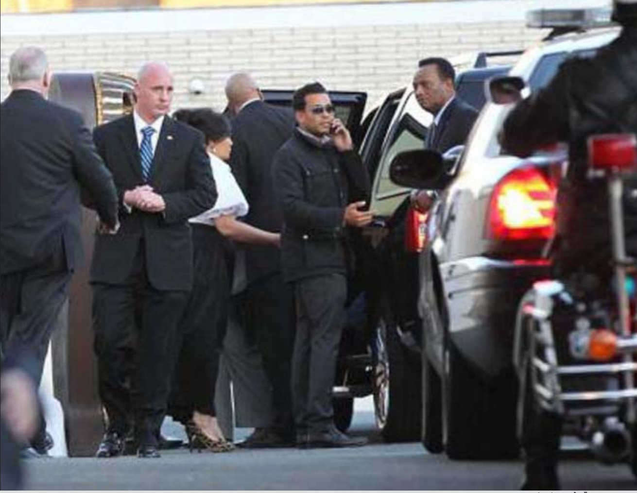
محبو هيوستن في وداعها