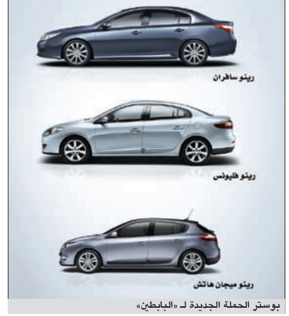
بوستر الحملة الجديدة لـ «البابطين»